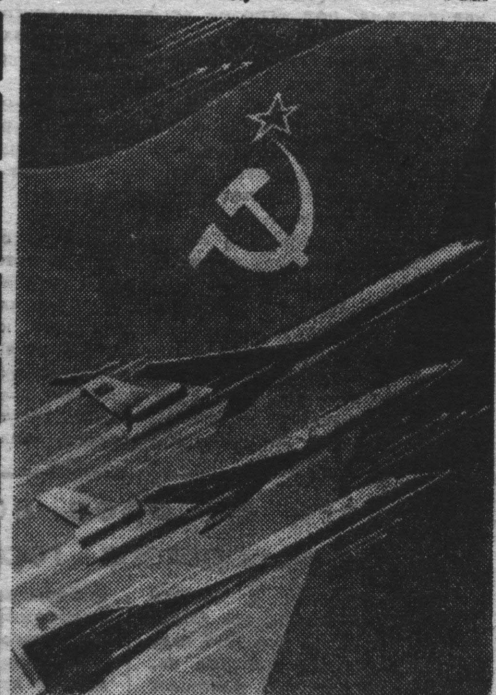
«ВЫШЕ, ДАЛЬШЕ, БЫСТРЕЕ». Плакат художника В. Викторова.