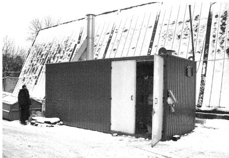
Обслуживать комплекс по обезвреживанию медицинских отходов может всего один человек.

Исходя из санитарных правил и требований СанПиНа возникает вопрос о создании своей муниципальной системы сбора и обезвреживания медицинских и биоорганических отходов. Одним из основных элементов этой системы должен стать комплекс по термическому обезвреживанию таких отходов. В настоящее время установка КТО50-К20 приобретена на средства областного и муниципального бюджетов более чем за 4,5 милли-