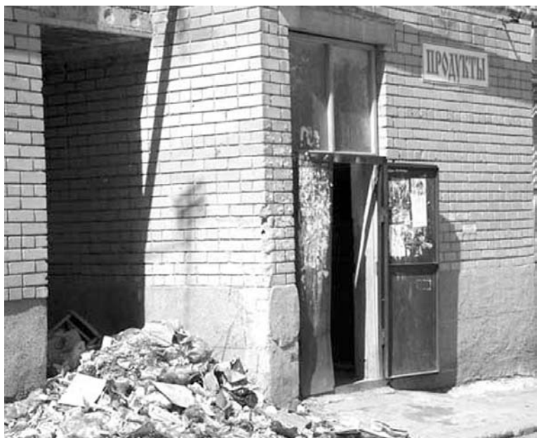
Такого безобразия в ТСЖ не допустят.

«Уважаемые жильцы, мы все объединились и создали ТСЖ «Уют». Этот способ управления и содержания нашего дома мы выбрали как наиболее эффективный. И в целях экономии средств для текущего ремонта мы будем соблюдать чистоту и создавать уют». Такое объявление встретилось в одном из подъездов. Но обо всем по порядку.