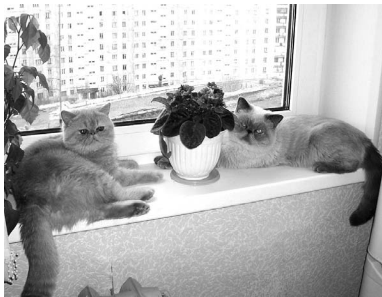
Чоня и Дэм - идеальные мурлыки: спящих хозяев будить не решаются.