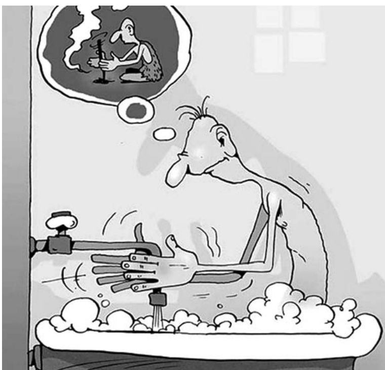
Обычно люди страдают от отсутствия горячей воды...