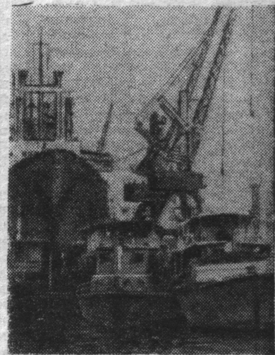
НА СНИМКЕ: суда из ГДР, доставившие ценные грузы в порт Хайфон — «морские ворота» республики.

Государства-члены СЭВ оказывают большую помощь Социалистической Республике Вьетнам в восстановлении народного хозяйства и создании материально-технической базы социализма.