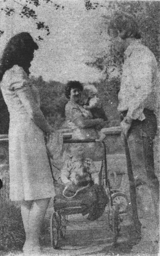
В парке у залива