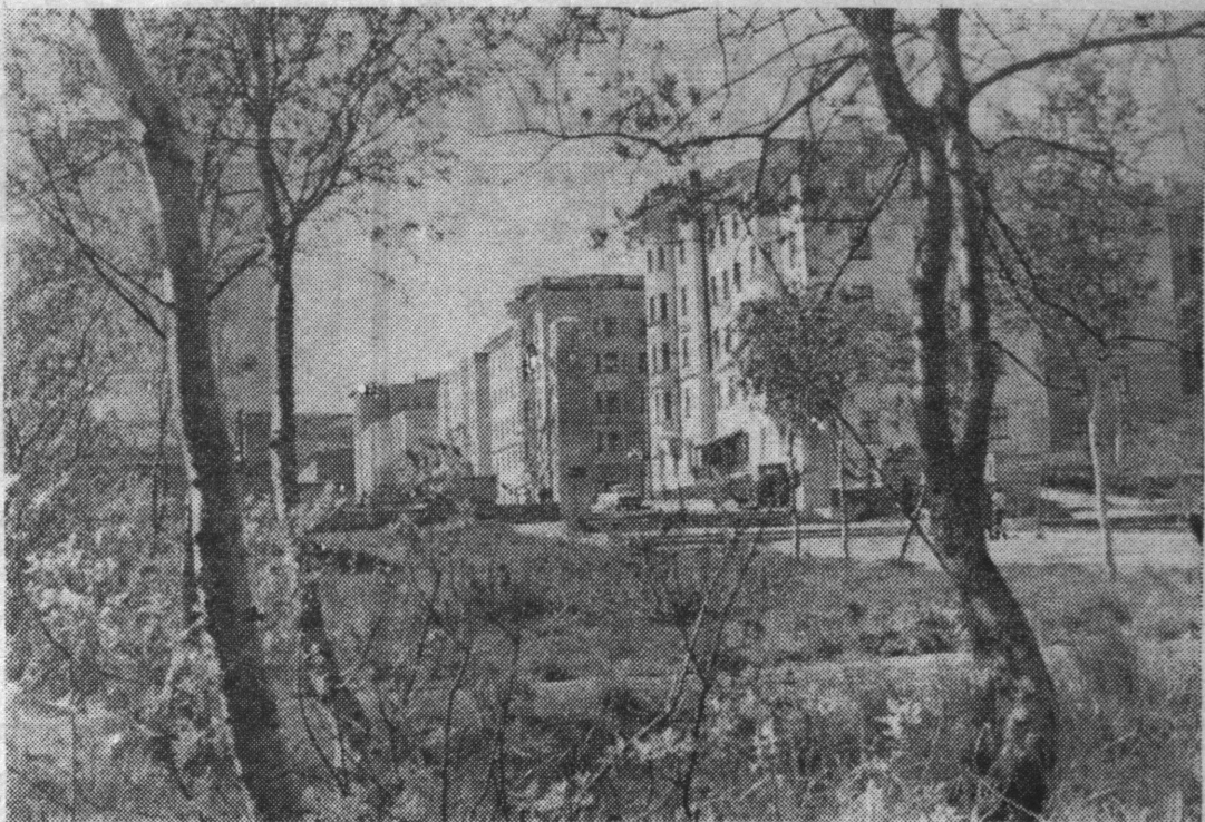
Североморск. Вид на город из городского парка.