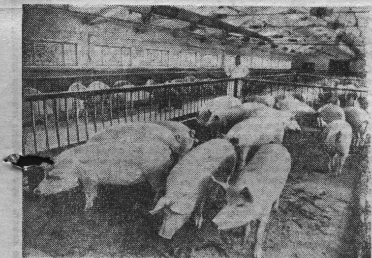
Латвийская ССР. В научно-опытном хозяйстве «Сигулда» Института животноводства и ветеринарии Латвийской ССР ведется целенаправленная племенная работа.