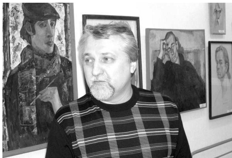
Иван Ворон: «Портрет подчеркивает индивидуальное, а фотография дает лишь общее представление».