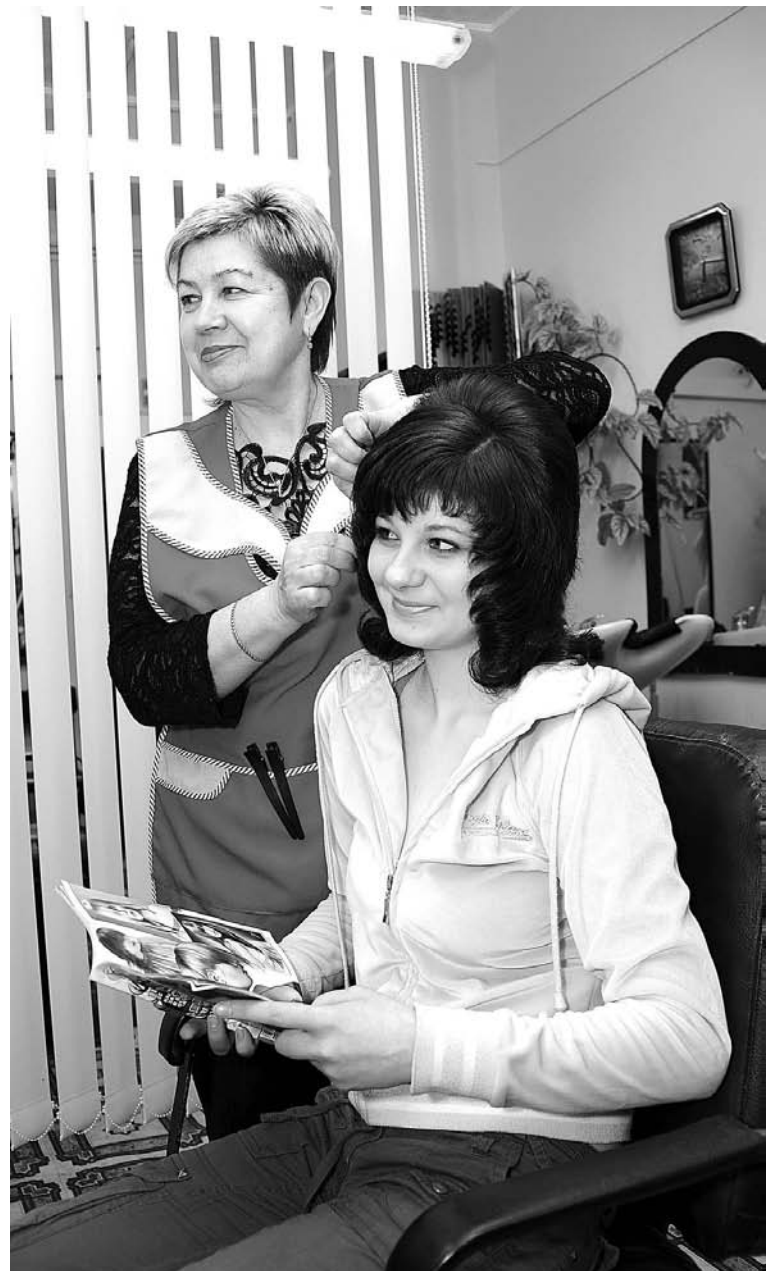
Мастер постарался - клиент доволен. Значит, все будет отлично.