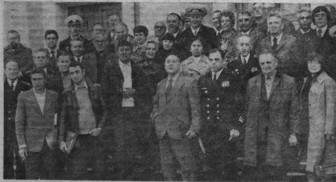
Дни советской литературы в Мурманской области. Писатели в Североморске.

С волнением слушали участники литературного вечера стихи Героя Социалистического Труда, лауреата Ленинской и Государственной премий, депутата Верховного Совета СССР Михаила Стельмаха. И