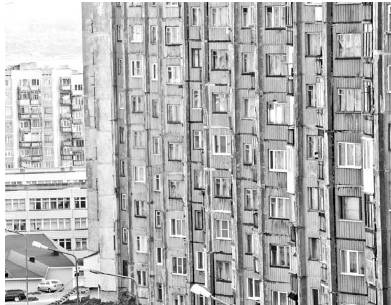
Тесное соседство и неудобная планировка - беда большинства североморских квартир. Пчелиный улей, честное слово!

Для поднятия настроения попробуем сравнить североморский и московский ценники. В Сафоновско-1 однокомнатную квартиру