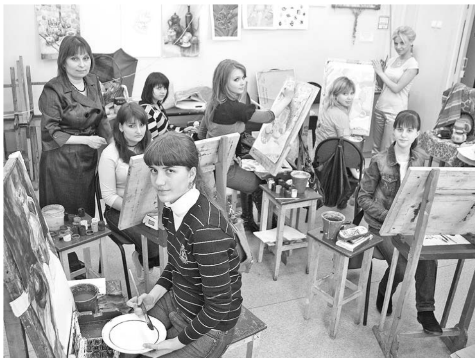
В настоящее время в школе занимаются порядка 300 юных художников.

Сейчас в художественную школу приходят заниматься дети начиная с 7 лет. Главная задача, стоящая перед преподавателями, увлечь ребенка творчеством.