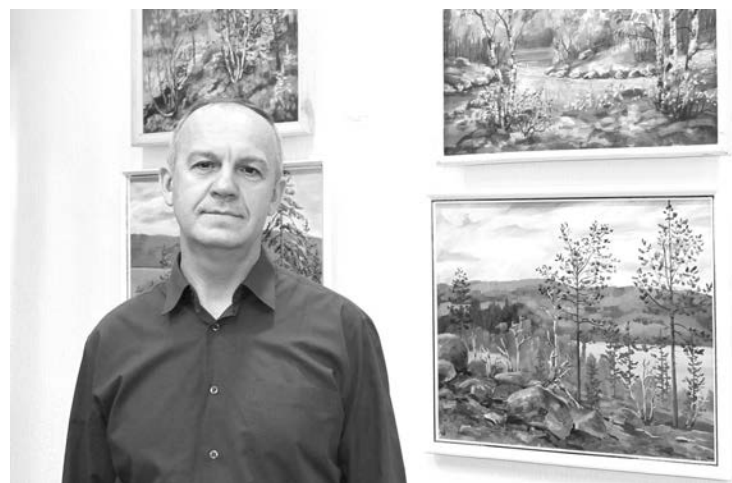
На выставке почти нет зимних пейзажей - просто на морозе слишком быстро замерзают краски.

В северной природе привлекает непредсказуемость и быстротечность каждого времени