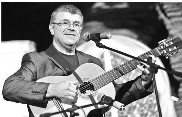
Очередной концерт Юрия Хабарова в Североморске ожидается в январе, после чего он отправится на гастроли в США.