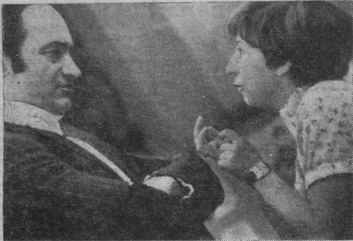
Москва. На киностудии «Мосфильм» известный советский кинорежиссер народный артист РСФСР, лауреат Государственной премии СССР Эльдар Рязанов приступил к съемкам сатирической комедии «Гараж». Сценарий Э. Брагинского и Э. Рязанова. Музыка к фильму написал Андрей Петров. В фильме заняты актеры: Л. Ахеджаков, Г. Бурков, В. Гафт, И. Косталевский, Л. Марков, А. Мягков, С. Немолояев, В. Невинный, О. Остроумова и другие.