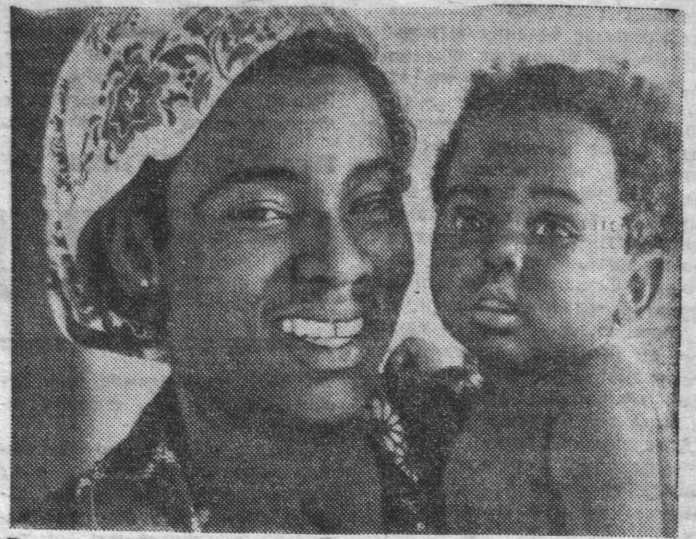
Партия ФРЕЛИМО и правительство Народной Республики Мозамбик проявляют заботу о воспитании подрастающего поколения.