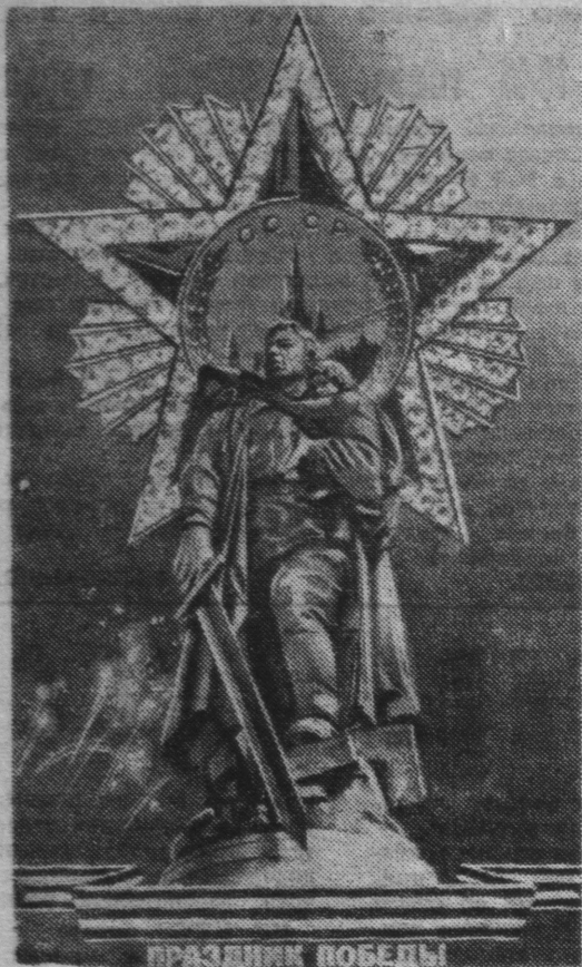
Плакат художника В. Викторова. Издательство «Плакат».