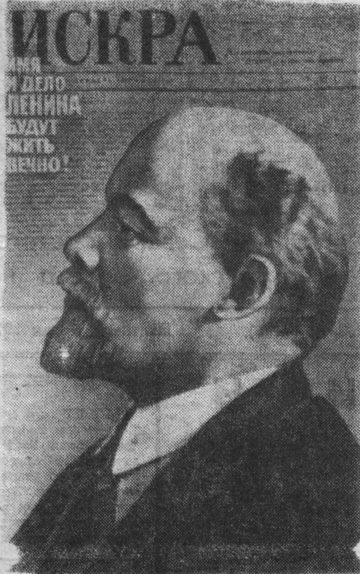
Плакат художника Б. Березовского. Издательство «Плакат».