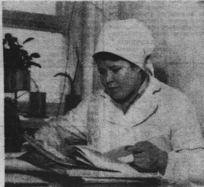
Портреты профсоюзных активистов