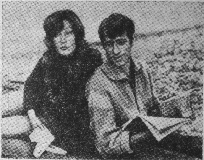
А. Зацепин и Л. Гарин, стихи — Л. Дербенев, К. Кулиев. В ролях заняты артисты: А. Будницкая, Н. Волков, А. Хочинский, В. Александров.

Главную роль в фильме исполняет популярная советская эстрадная певица Алла Пугачева. Это ее дебют в кино. А. Пугачева выступает в фильме не только как актриса, певица, но и как автор музыки и стихов к песням. Музыку к кинофильму написали также