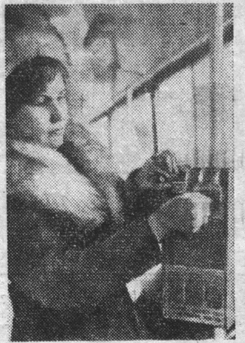
Венгрия. На городских автобусах в Эгере (область Хевеш) в этом году установлены автоматические билетные кассы советского производства.