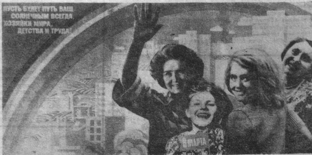
Плакат художника Л. Тарасовой.

СЕВЕРОМОРСКИЙ ГОРКОМ КПСС. ИСПОЛКОМ ГОРОДСКОГО СОВЕТА НАРОДНЫХ ДЕПУТАТОВ.