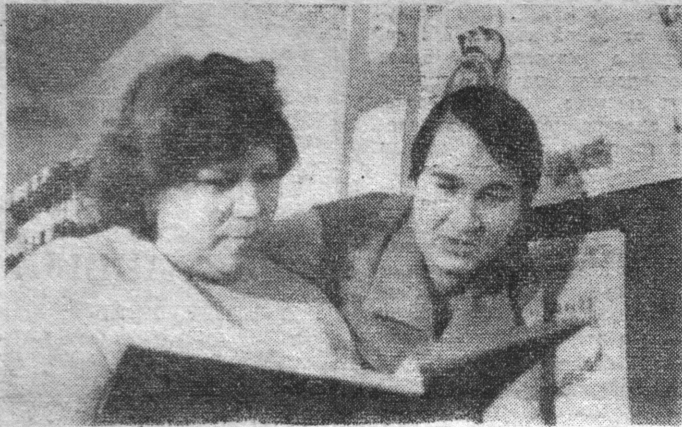
Портреты профсоюзных активистов