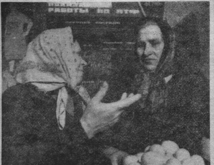
Фото В. Матвейчука, с. Белокаменка.

ВОЙНА и врач — как не совместимы эти понятия. Война — это смерть и горе, врач побеждает смерть и дарит человеку счастье жизни. Именно в войну зародилась в детском сердце Вали мечта стать врачом.