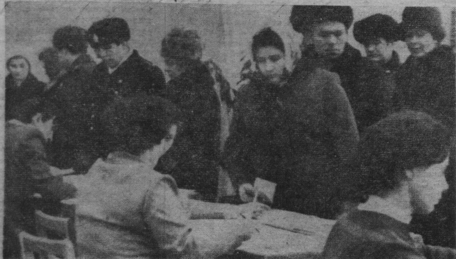
НА СНИМКАХ: на одном из избирательных участков; они уже проголосовали.