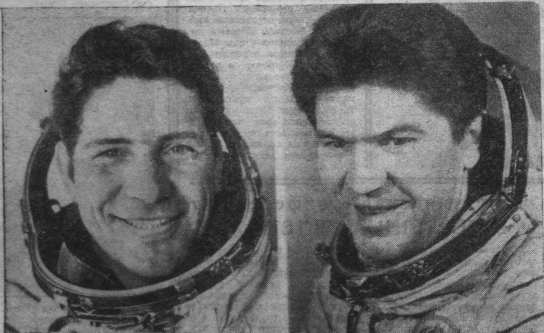
Экипаж космического корабля «Союз-32» — командир корабля подполковник Владимир Афанасьевич Ляхов (на левом снимке) и бортинженер летчик-космонавт СССР Валерий Викторович Рюмин.