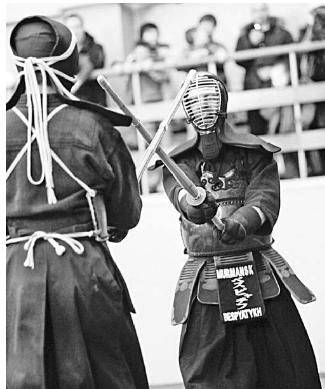
Кендо пришло в Североморск - пока с ознакомительным визитом.

- В России кендо развивается больше 20 лет, проводятся турниры. Во многих городах есть и детские группы. В Мурманске клуб существует с 1997 года, но занимались мы больше кен-дзюцу. А в российскую федерацию кендо вступили в 2005 году. В наш клуб принимаются все желающие от 14 лет. В области пока единственные, кто занимается кендо, но, не исключено, появится воз-