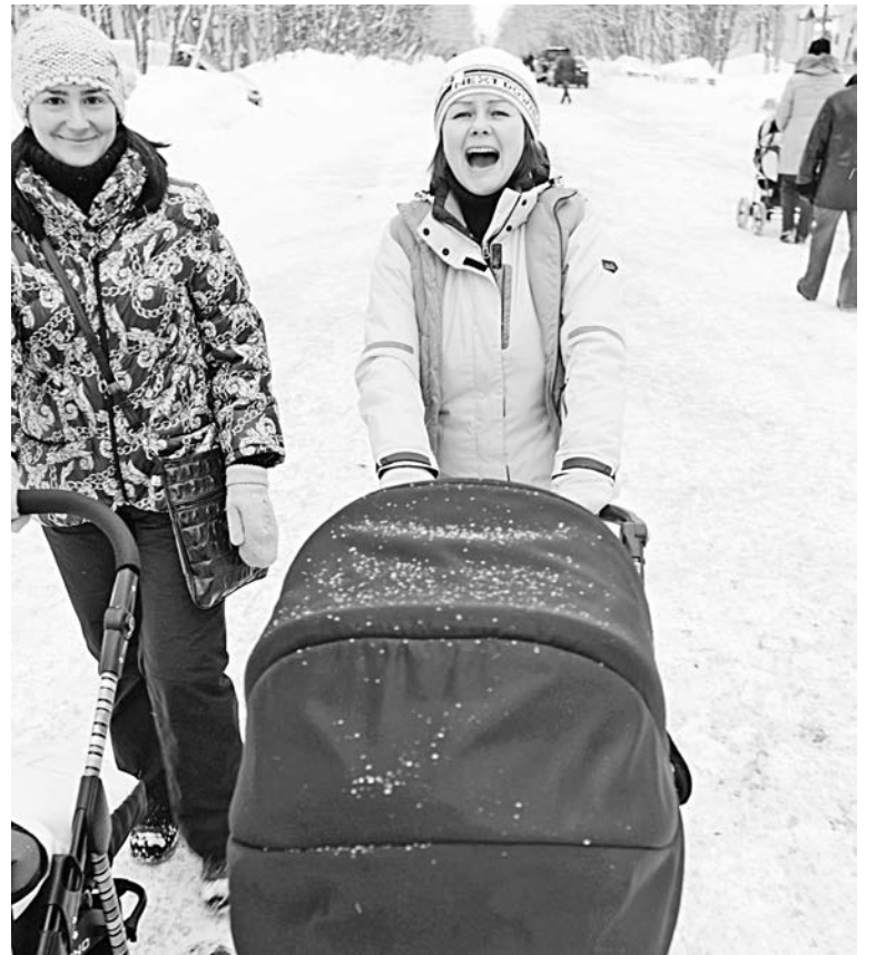
На мамах и детях решено пока не экономить.

- После принятия поправок в 212-й федеральный закон пособия будущим мамам будут пересчитаны с 1 января 2011 года. Женщинам предоставят на два года право выбора методики расчета пособий. А с 1 января 2013г. все выплаты по временной нетрудоспособности, по беременности и родам будут производиться исходя из расчетов за два года, и порядок будет один для всех. Касательно поправок методики расчета пособия: если женщина выйдет на работу в 2013г., а в прошлые годы, находясь в