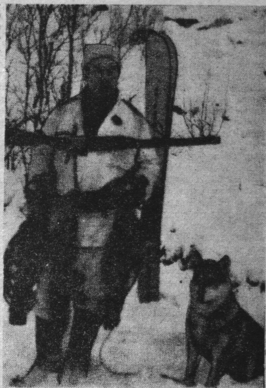
НА СНИМКЕ: такой трофей не в тягость.

Я ХОЧУ рассказать об обществе книголюбов, которое работает при нашей поселковой библиотеке.