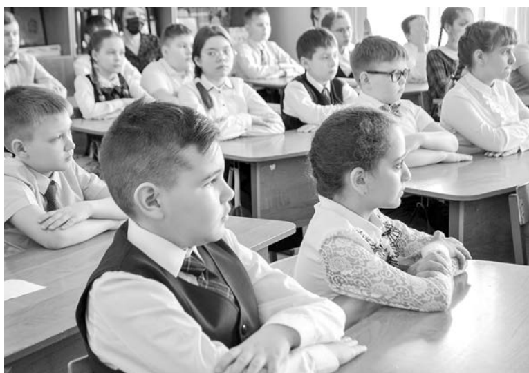
Четвероклассников глубоко тронула судьба главного героя фильма — мальчика, больного лейкемией.

В рамках проекта «Новая школа» партии «Единая Россия» в школах ЗАТО Североморск уже второй год реализуется проект «Киноуроки в школах России». Каждый раз 20-30-минутный киносюжет посвящен какой-то важной теме, рассчитанной на определенный возраст школьника.