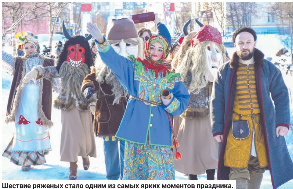
Шествие ряженых стало одним из самых ярких моментов праздника.