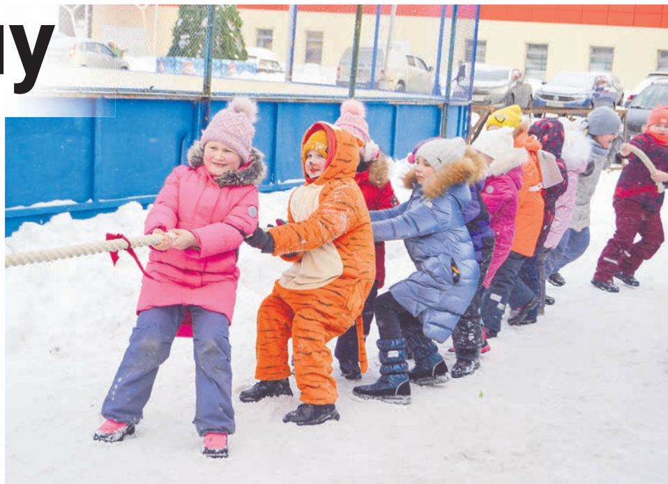
Юные сафоновцы с удовольствием принимают участие в праздничных играх и забавах.