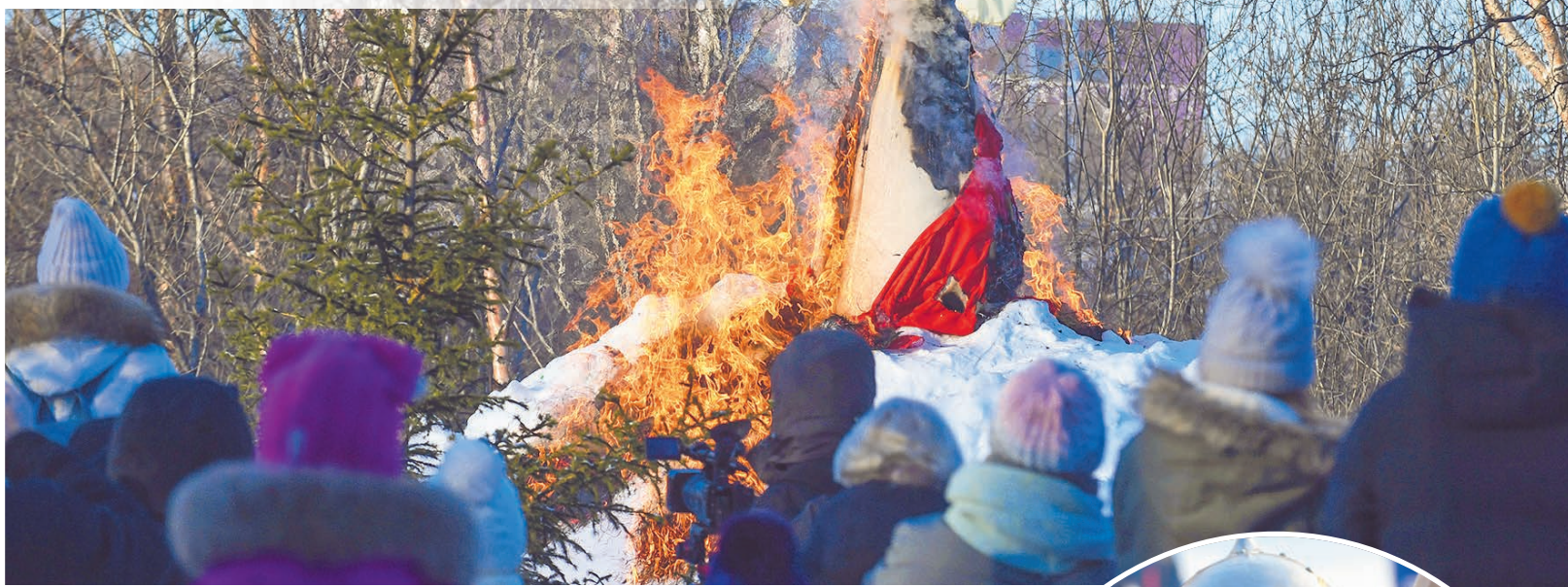
Сжигание чучела на Масленицу символизирует проводы зимы и встречу весны. И выглядит эффектно.

На «Исторической площадке» клуба реконструкторов «Фьорд» и мастерской исторического костюма «Светлица» можно было посмотреть на работу кузнеца и чеканщика монет, примерить шлем, поиграть в городки, проверить свою меткость и реакцию, приобрести изделия ручной работы. На Аллее спорта — поучаствовать в «Масленичном семейном марафоне», орга-