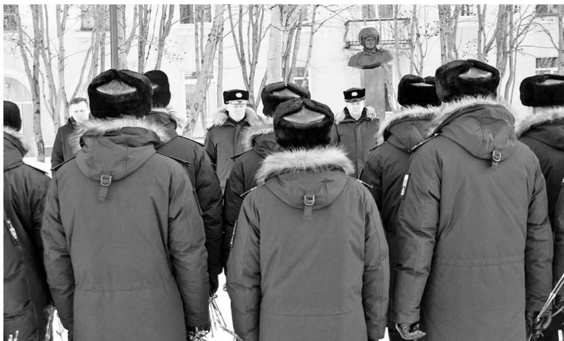
В памятные даты военные летчики традиционно собираются у бюста Тимуру Апакидзе на митинг и возложение цветов.

9 марта музей истории города и флота СМВК совместно с воспитанниками Североморского кадетского корпуса и учениками СШ №10 провел Вахту памяти, приуроченную ко дню рождения Тимура Автандиловича Апакидзе.