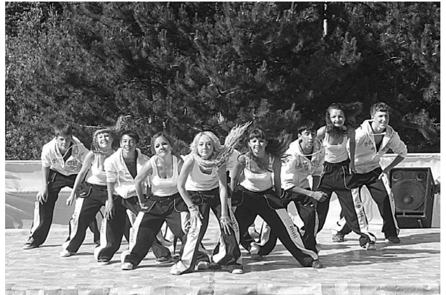
«Динамикс» – лауреат 3-й степени в номинации «Современная хореография» фестиваля «Синеокая Анапа».