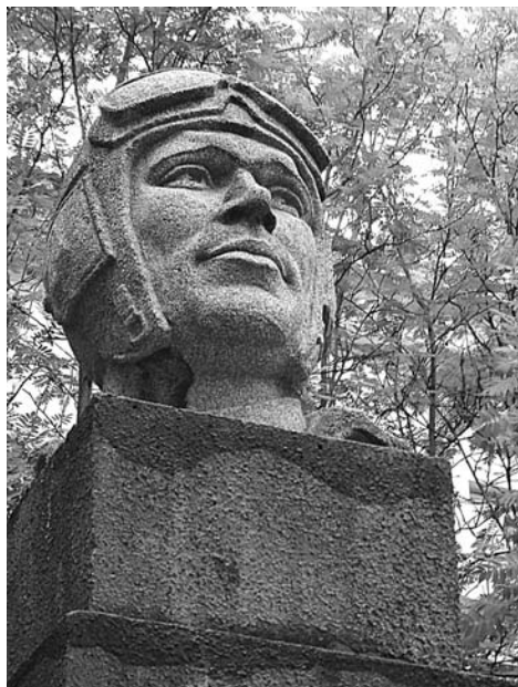
От памятника Сафонову на одноименной площади уже отколотся фрагмент (справа под шлемофоном).