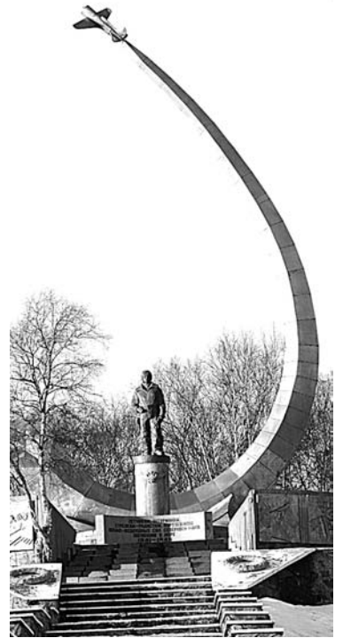
Памятник авиаторам, погибшим в море в годы Великой Отечественной войны, был открыт в Сафоново в 1986 году.

Ирина ПАЛАМАРЧУК.