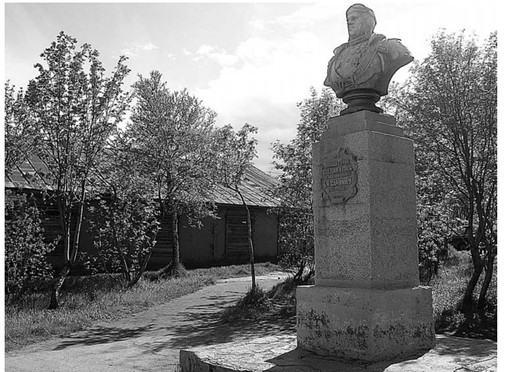
В Авиагородке на ладан дышит постамент памятника. Под ржавыми потеками скоро будет невозможно прочесть имя героя Бориса Сафонова.

Так что идея переноса бюста, а точнее рокировки памятников Сафонову, активно обсуждается в администрации. С одной стороны, перенос бюста Кербеля на