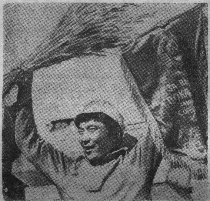
1978 г. Есть миллиард пудов казахстанского хлеба!