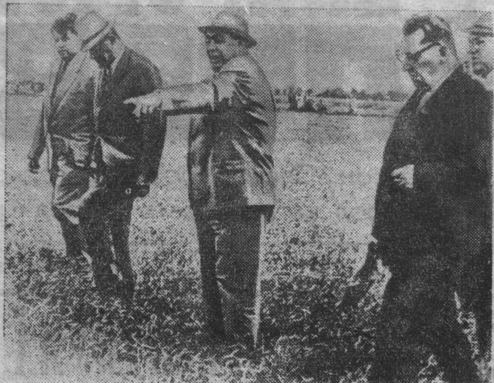
Л. И. Брежнев в целинном совхозе.