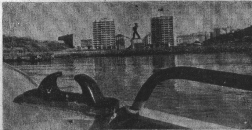
Город Североморск. Вид на Приморскую площадь.

И в том, что партийная организация на участке стала главной мобилизующей и направляющей силой, большая заслуга ее секретаря С. Ф.