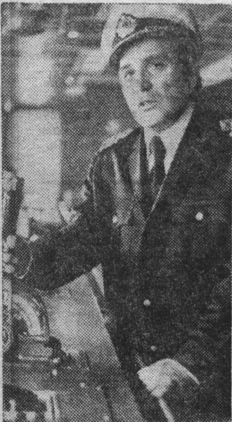
Украинская ССР. Начала действовать первая очередь международной паромной переправы железнодорожных составов Ильичевск — Варна.

Два советских и два болгарских автоматизированных судна-парома: «Герои Плевена», «Герои Шипки», «Герои Севастополя», «Герои Одессы» будут брать на свои автоматизированные палубы по 108 железнодорожных четырехосных вагонов каждый. Грузооборот «плавающего моста»