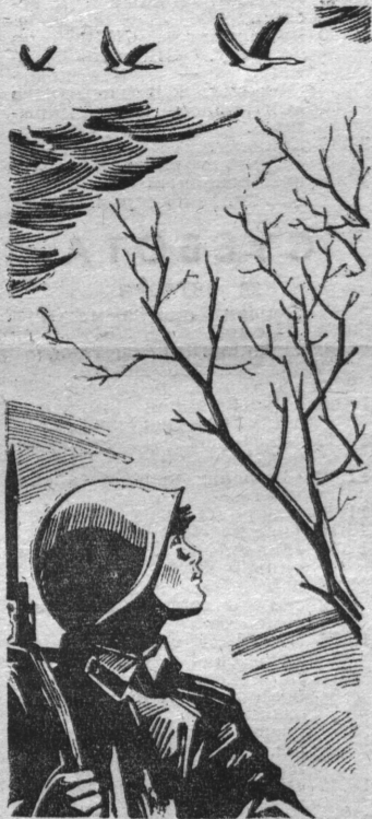
Рисунок В. Егорова.

ИДУ по пустынным улицам города. Поздно. А мне не спится. Причина моего внут- реннего беспокойства — сегод- няшняя находка: в кармане сына обнаружена пачка сигар- рет. Жену попытался успоко- ить: сын почти взрослый, и то, что он начал курить — еще не самый худший из пороков, а точнее — дурная привычка.