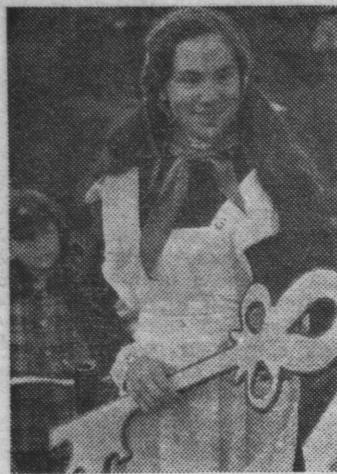
К сожаленью, день рождения — только раз в году...

А оркестр играл популярную песенку из мультфильма о Чебурашке: