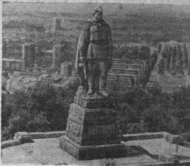
НРБ. В честь беспримерного подвига Советской Армии на болгарской земле установлены десятки памятников. Один из самых грандиозных — на холме Освободителей в Пловдиве. Величественная фигура советского воина-освободителя, высеченная из серого гранита, видна из всех уголков города. В Болгарии эту скульптуру любовно называют русским именем — Алеша...

9 сентября — 34-я годовщина социалистической революции в Болгарии