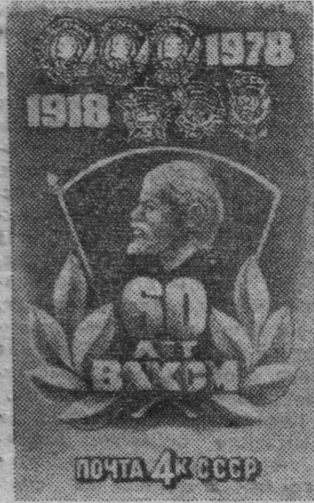
Москва. Министерство связи СССР выпустило почтовую марку, посвященную 60-летию ВЛКСМ (на снимке).