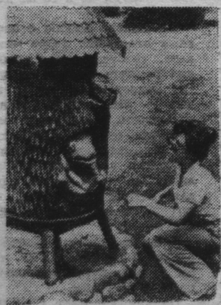
Польша. Сюжет народной сказки о лягушке-хранительнице меда использовал мастер-выдумщик, создавая этот улей-теремок. Сейчас он является экспонатом этнографического музея близ Познани.

Типография «На страже Заполярья». Заказ 412. Тираж 6209.