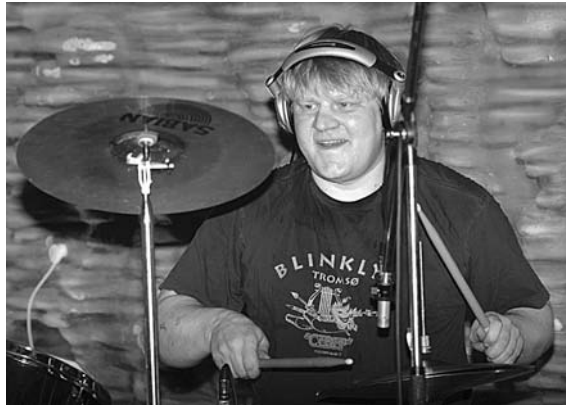
... - обладатели диплома прошлого года «За креативность».