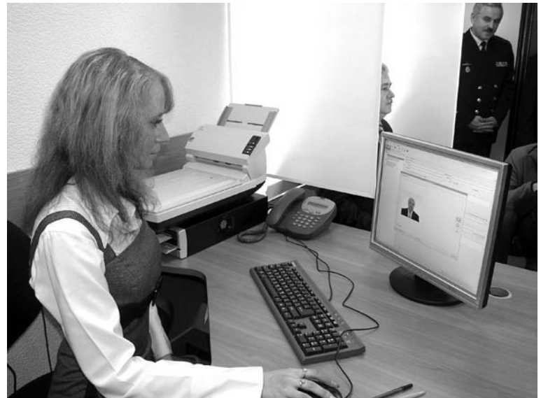
Работать с гражданами будут два инспектора, прошедших специальное обучение в Москве.

4 февраля в Межрайонном отделе УФМС по Мурманской области начали прием документов у граждан, желающих оформить биопаспорта. Подать документы могут не только жители флотской столицы, но и других ЗАТО – Полярного, Гаджиево, Островного, Заозерска и Снежногорска. Желание получить биопаспорт могут одновременно проконсультроваться, а сам прием ведется по записи. Все это позволяет избежать очередей перед кабинетом. Записаться можно по телефону: 4-69-06 - с 09.00 до 17.30 (с 13.00 до 14.00 перерыв на обед). Необходимую информацию можно найти и на официальном сайте УФМС по Мурманской области: www.ufmsmur.ru . Там же размещены бланки заявления о выдаче паспорта нового поколения. Кстати, формы с сайта можно заполнить и распечатать в трех экземплярах, два из которых заверяются по месту работы. Третий экземпляр сканируется инспектором при приеме документов и позволяет избежать механической ручной работы (данные заносятся