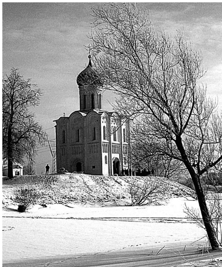
Неописуемо красиво это место весной, в половодье, когда от холма, на котором стоит церковь Покрова на Нерли, остается крошечный островок.

Расписывали его знаменитые иконописцы Андрей Рублев и