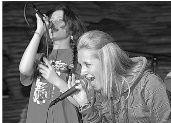
В мурманской группе «Seven F.days» главная партия - у девушек.

кие солистки и «мощные» рокеры со стажем, угловатые студенты, делающие первые шаги в музыке, и даже матросы. Кстати, флотская группа «Экипаж» получила чуть ли не самую мощную поддержку зрителей, среди которых также были военнослужащие. Одним словом, каждый пришедший на фестиваль нашел «свой» коллектив.