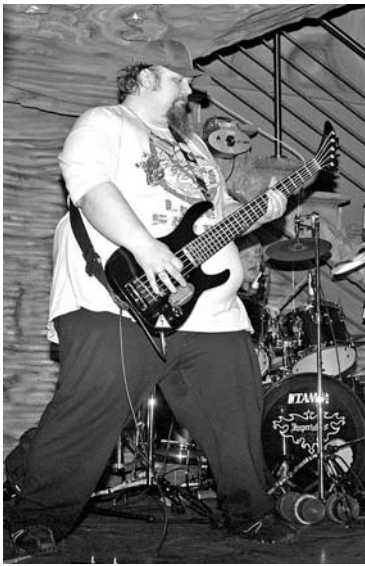
Группа «Тремор» (г.Полярный) - ...

Похоже, что в обозримом будущем Североморск станет не только столицей Северного флота, но и столицей заполярного рока. Судите сами: открытый городской фестиваль рок-музыки «Живой звук», прошедший 31 января в Центре досуга молодежи «Россия», проводится лишь второй раз, а показать здесь свое творчество приехало без малого 17 коллективов. Некоторые участники прибыли даже из Кандалакши и Кировска.