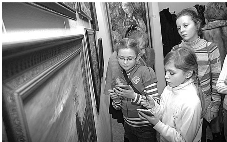
Многочисленные зрители, даже самые юные, всерьез заинтересовались выставкой.