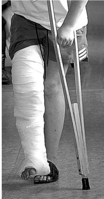
Только врачи «скорой помощи» за время гололеда обслужили 21 пострадавшего.

Позаботиться о собственной безопасности должны и пешеходы. Собираясь на работу или важную встречу, выходите заблаговременно, тогда вам не придется бежать сломя голову, срезать путь, пересекая газоны и скло-