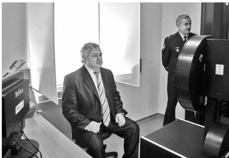
Возможности специального фотооборудования опробовал Глава ЗАТО г. Североморск Виталий Волошин.