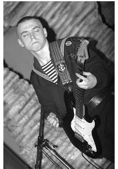
Выступление североморского «Экипажа».

В зале были развешаны листовки с информацией о профилактике СПИДа, наркомании, табакокурения, указаны телефоны, по которым можно получить помощь, лицом к лицу столкнувшись с этими проблемами. Ну а музыканты постарались убедить молодежь в преимуществах здорового образа жизни, исполняя зажигательные композиции, полные довольно редкого для рока оптимизма. Поражала воображение и разноплановость образов, выбранных исполнителями. Юные хруп-