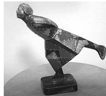
Александр Молев, «Конькобежец», 2008 (металл).