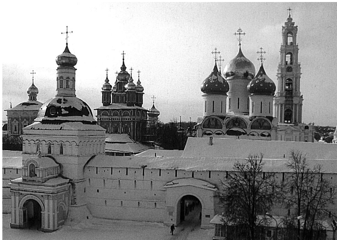
Великолепный вид на Троице-Сергиеву лавру открывается со стороны фасада.

Наталья ПЕТРОВСКАЯ. Фото автора и из Интернета.