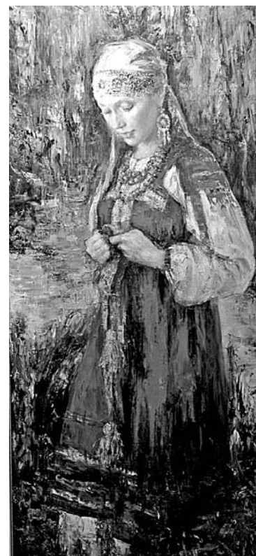
Анна Виноградова, «Прогулка», 2009 (холст, масло).