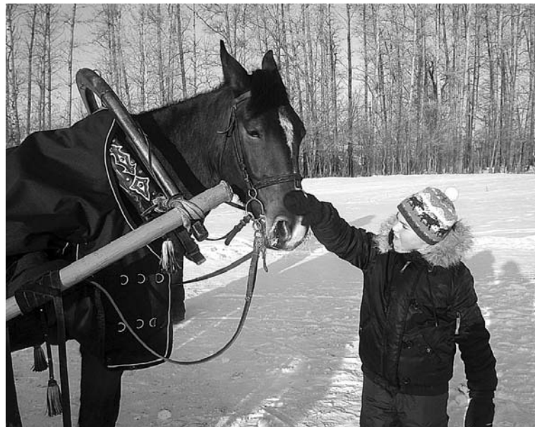
Зимой от села Боголюбково до храма Покрова на Нерли можно добраться на санях. Стоит это удовольствие всего 200 рублей.