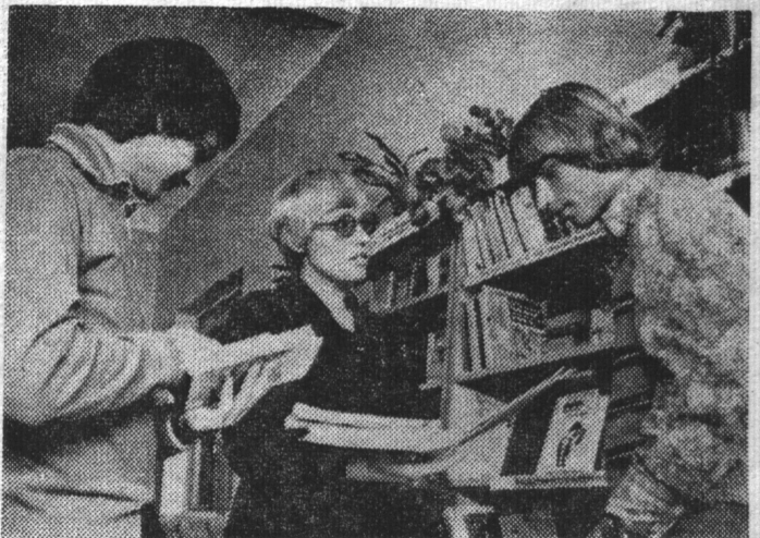
Более 18 тысяч экземпляров общественно-политической, технической и художественной литературы сосредоточено в библиотеке № 2 поселка Росляково, филиале Североморской централизованной библиотечной системы.

Коллектив поселковой библиотеки ведет активную пропаганду книги, часто устраивает читательские конференции, вечера, организует тематические книжные выставки по различным темам.