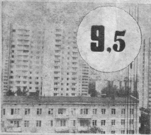
РОСТ РЕАЛЬНЫХ ДОХОДОВ НАСЕЛЕНИЯ В СССР (в расчете на душу населения; в процентах)

ЕЖЕДНЕВНО В НАШЕЙ СТРАНЕ СДАЕТСЯ В ЭКСПЛУАТАЦИЮ КВАРТИР (в тыс.) ПРИМЕРНО