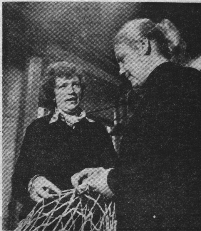
банас присвоили первый разряд сетевязи.