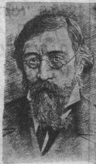
Н. Г. Чернышевский

24 июля исполнилось 150 лет со дня рождения Николая Гавриловича Чернышевского (1828—1889). Жизненный подвиг великого русского революционного демократа, выдающегося ученого, глубокого мыслителя — материалиста, блестящего писателя и литературного критика навсегда вошел в историю России. Его деятельность, пронизанная ненавистью к крепостничеству и самодержавию, была посвящена защите угнетенного народа и составила эпоху в истории русского освободительного движения, истории русской науки и культуры. Признанный глава революционных демократов, он оказал огромное влияние не только на передовых людей России своего времени, но и на последующие поколения революционеров.