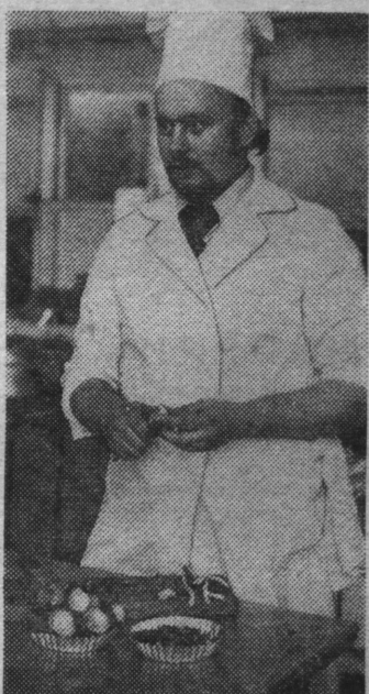
ной премии и Почетной грамоты. Фотографии победителей будут вывешены на стенд «Лучшие по профессии 1978 года».

23 июля, в День работника торговли, состоится торжественное награждение победителей смотра-конкурса. Занявшим первые места будут присвоены звания «Лучший кондитер», «Лучший повар», «Лучший официант» с вручением алой памятной ленты, денеж-