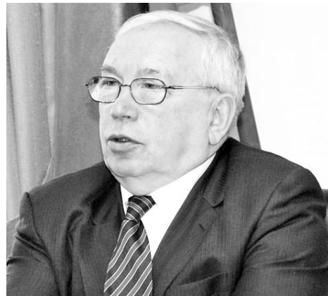
Уполномоченный по правам человека в РФ Владимир Лукин.

Общее собрание – высший орган управления товариществом. Наиболее важные, принципиальные вопросы «общедомовой» жизни решаются совместно непосредственно собственниками помещений на общем собрании, текущей занимается правление ТСЖ, избранное из членов товарищества, также на общем собрании. Правление и его председатель работают под контролем жителей дома: не реже раза в год финансовую деятельность управленцев проверяет ревизионная комиссия, сформированная из соб-