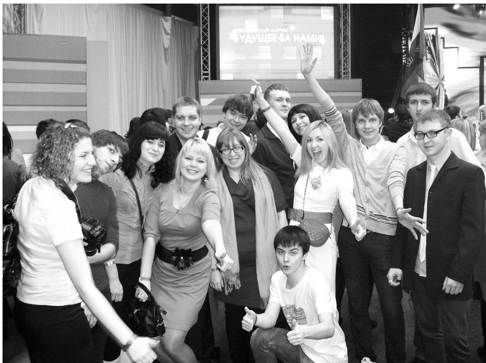
Пока молодежь волнуют социальные проблемы, можно надеяться на светлое будущее.