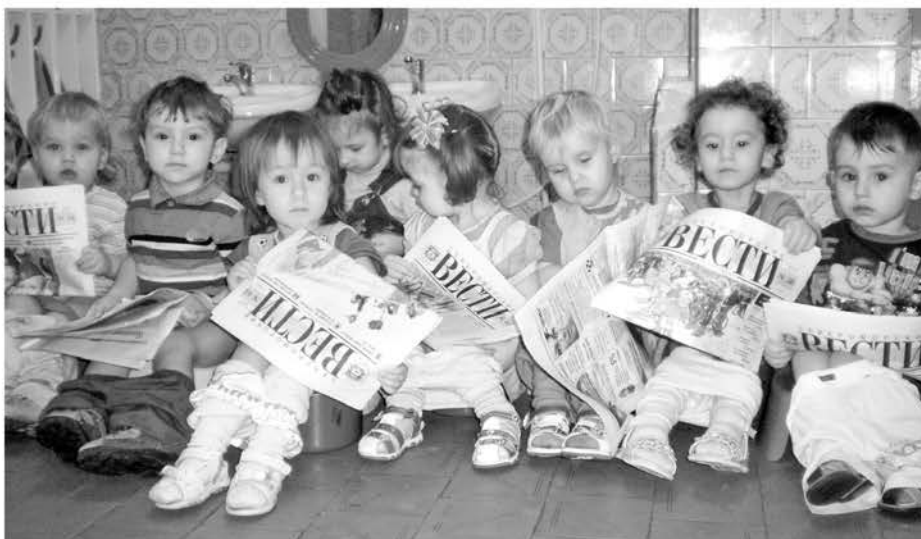
«С Вестями вместе» за развитием городских событий следят даже малыши ясельной группы «Светлячок» д/с №11 «Родничок».

Ждем снимки по адресу: ул. Сафонова, 18, по электронной почте: severomorka@gmail.com, а также в нашей группе в социальной сети «ВКонтакте». Справки по телефону: 4-84-06.