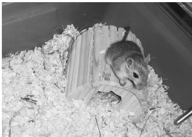
Для содержания песчанок клетка предпочтительнее террариума: между вами и общительным зверьком не будет стеклянной преграды.

Песчанкам просто необходимо общение с себе подобными. Обычно, в до-