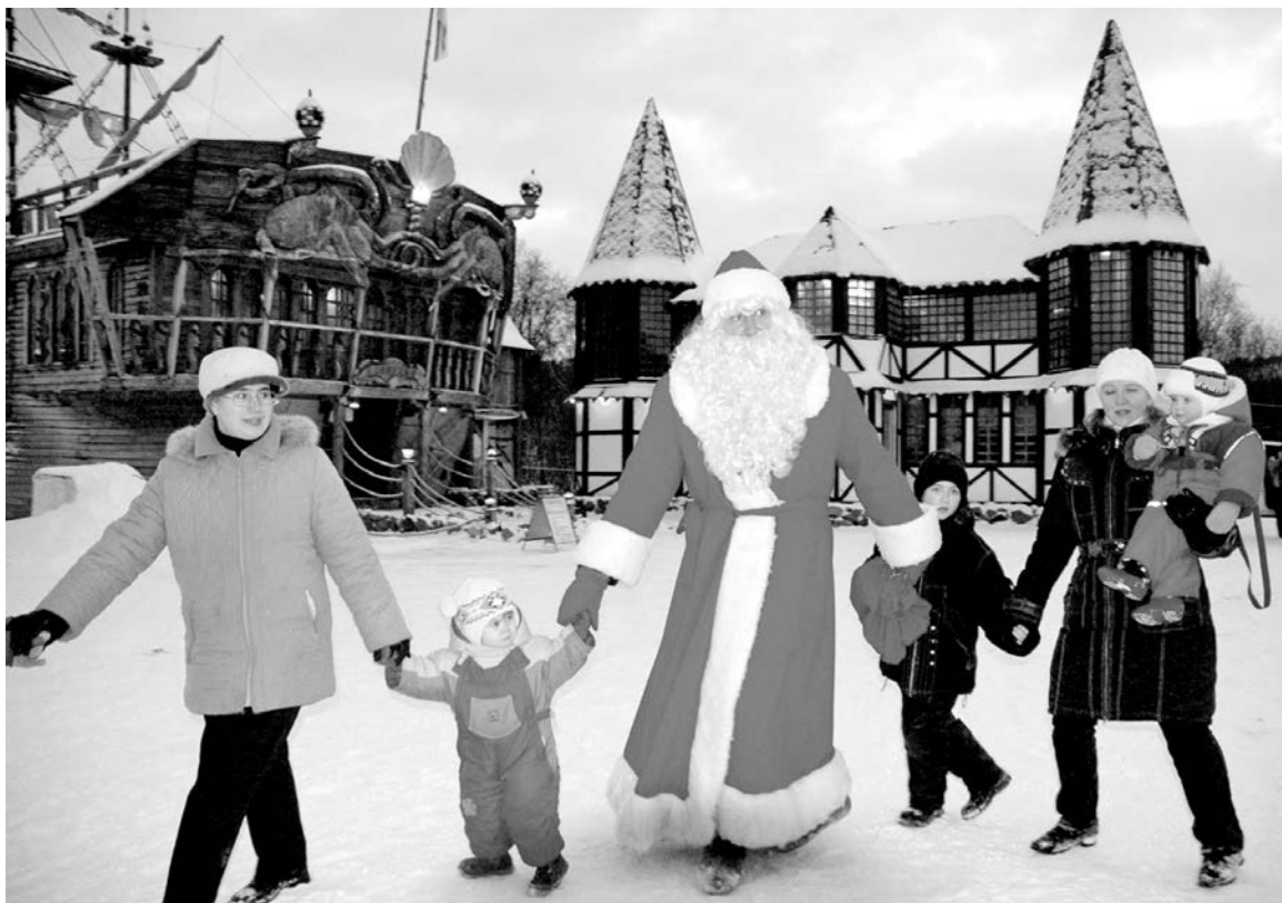
На новогодних каникулах возле кафе «Ангел» традиционно работает детская площадка с Дедом Морозом.

Вместе с обустройством кафе бизнес-леди привела в порядок и прилегающую территорию, превратив ее в настоящий оазис. Теперь в теплое время года, сидя за чашкой кофе, посетители