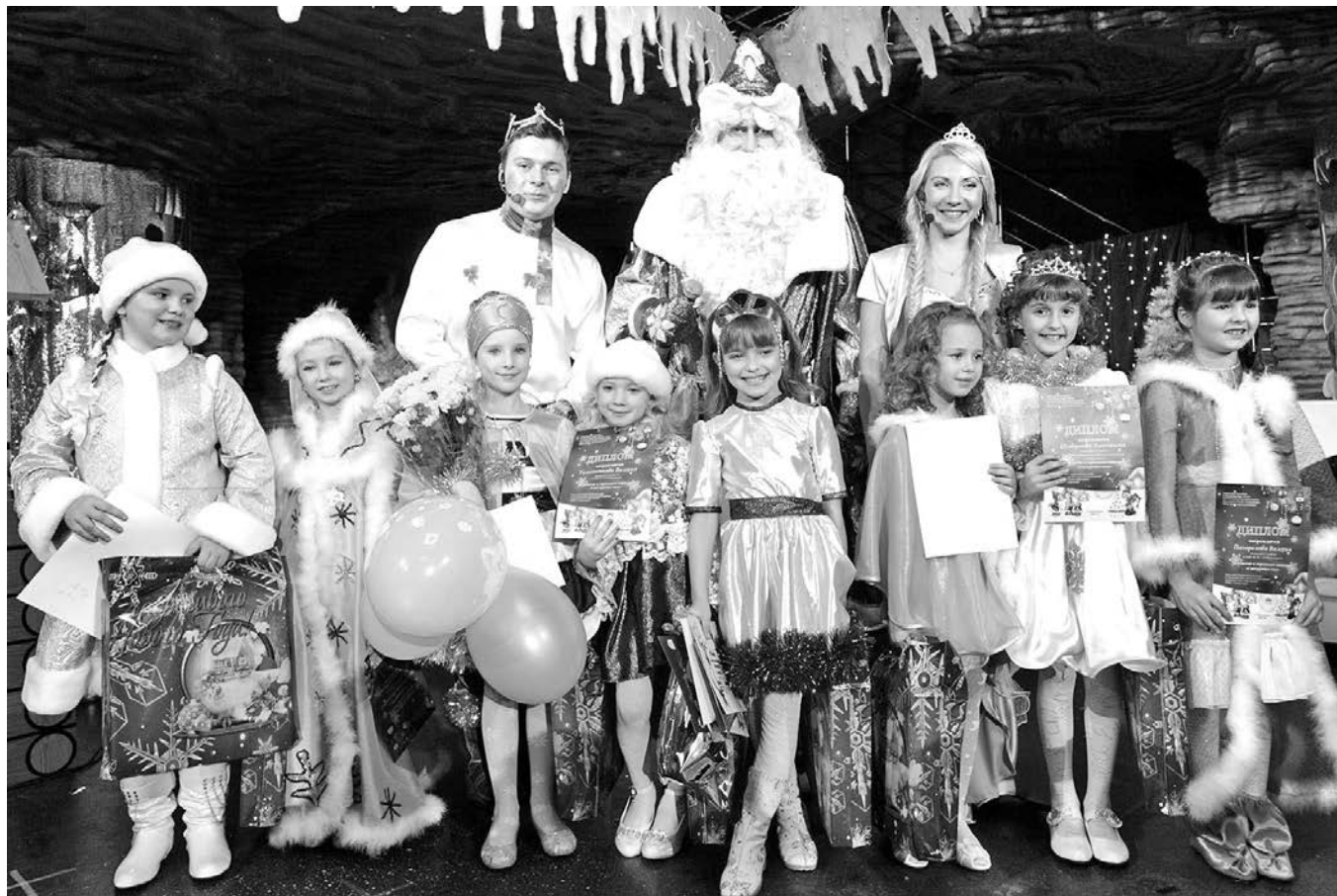
Все Снегурочки постарались на славу: и ёлку нарядили, и праздник устроили, и Емеле с Несмеяной помогли.