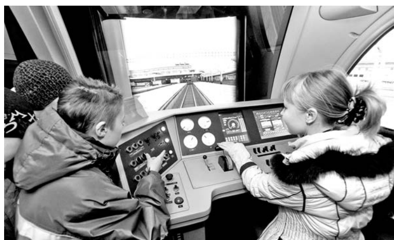
Детвора смогла поуправлять поездом на специальном модуляторе. Ожидали своей очереди и взрослые.