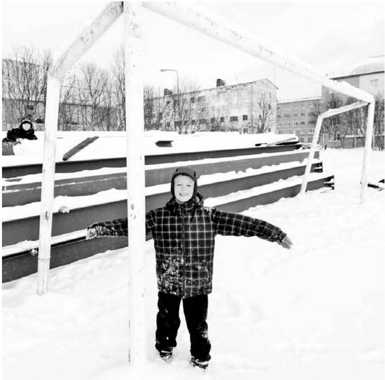
За строительными работами внимательно следит любопытная детвора: каким он будет, новый спорткомплекс?

Жители Авиагородка уже месяц наблюдают за тем, как местный стадион превращается в строительную площадку. Догадки о том, что именно здесь появится обещанный Министерством обороны спорткомплекс, укрепились. На прошлой неделе пресс-служба Западного военного округа возвестила на официальном сайте ведомства о начале возведения в Североморске и Гаджиево универсальных спортивно-оздоровительных комплексов и даже обнародовала план-схему будущей постройки.