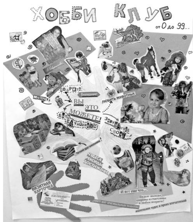
Коллаж Росляковской библиотеки №1 «Хобби клуб от 0 до 99».

лаж, инсталляция и видеоролик. Участвуют в конкурсе все: детские сады, школы, клубы, свободные мастера и признанные художники из Североморска и поселков. Интересные, смешные и удивляющие