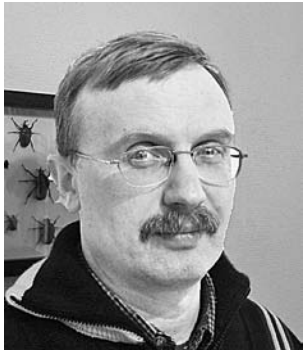
Илья Бояшов, известный документалист.