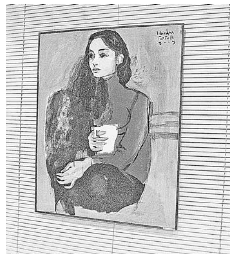
Портрет кисти Михаила Глотова.

Алексей ИЛЬЧЕНКО.