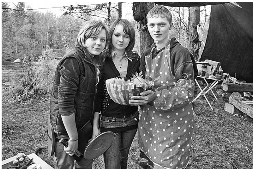
Вкусный обед от команды «Школа выживания».

В минувшие выходные на озере Домашнем прошел седьмой туристический слет «Приключения лета», организованный городским отделом по делам молодежи.