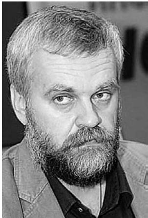
Алексей Варламов, исследователь-биограф.

Совсем скоро североморцам и всем жителям области представится уникальная возможность пообщаться с представителями современной литературной элиты и задать им свои вопросы. Авторы, чьи произведения самые востребованные и известные, посетят нашу область в рамках совместного проекта «Большая книга – встречи в провинции» Федерального агентства по печати и массовым коммуникациям и Фонда «Пушкинская библиотека». Главная цель акции – привлечь читательское и общественное внимание к лучшим произведениям современных авторов.