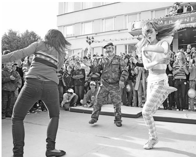
Зрители не могли устоять на месте во время танца «тектонических» девчонок.

Увлеченных мальчишек и девчонок собрал в воскресенье II городской фестиваль уличных танцев «Энергия лета», который заставил качаться добрую половину Североморска, по крайней мере, верхнюю его часть точно. Яркое мероприятие приурочили к открытию нового сезона в Городском молодежном клубе (ГМК).