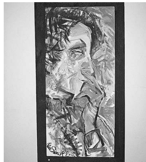
Одна из работ дебютанта А.Сухих.