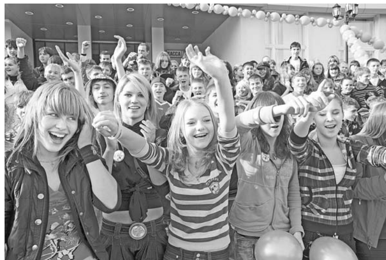
Публика поддерживала танцоров не только аплодисментами, но и комплиментами.