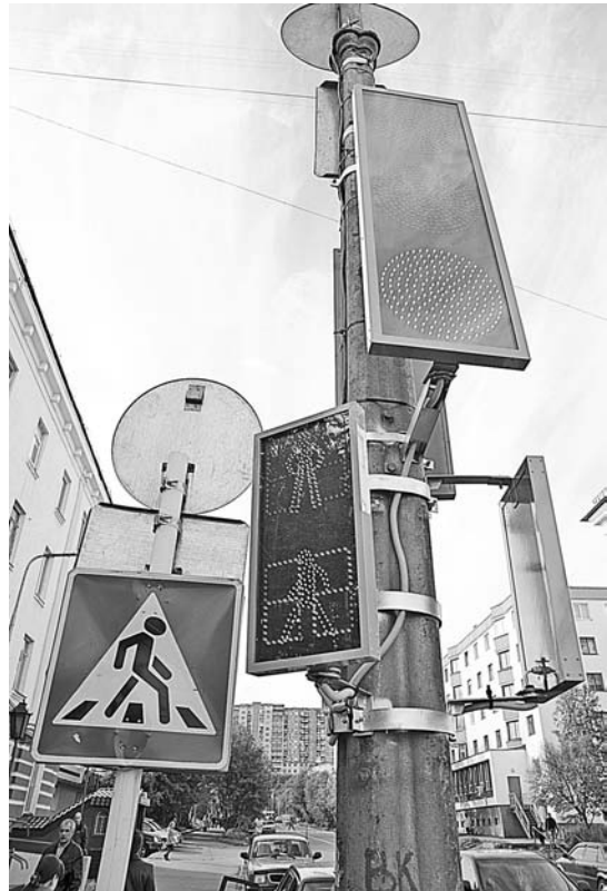
Светофоры оборудуют звуковым сигналом, который ориентирует слабовидящих пешеходов.