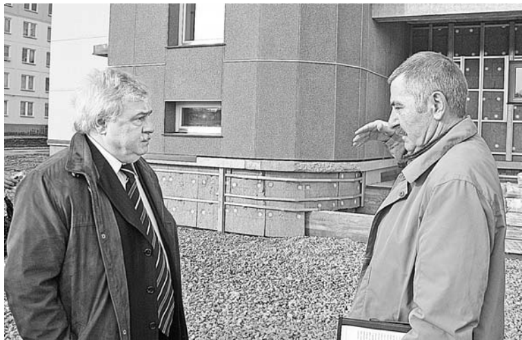
Мэр со строителями и журналистами осмотрел баню: номера люкс, общие отделения и другие помещения.

Оттого-то и вырос за считанные месяцы на улице Чабаненко настоящий дворец – новый детский сад. Первоначально его планировалось сдать в следующем году, но возникли финансовые трудности, поскольку в 2009-м на 34 миллиона были сокращены ассигнования из федерального бюджета. Тем не менее, Глава ЗАТО г. Североморск Виталий Иванович заве-