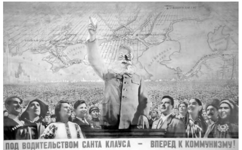
Санта-Клаус в ипостаси Сталина.