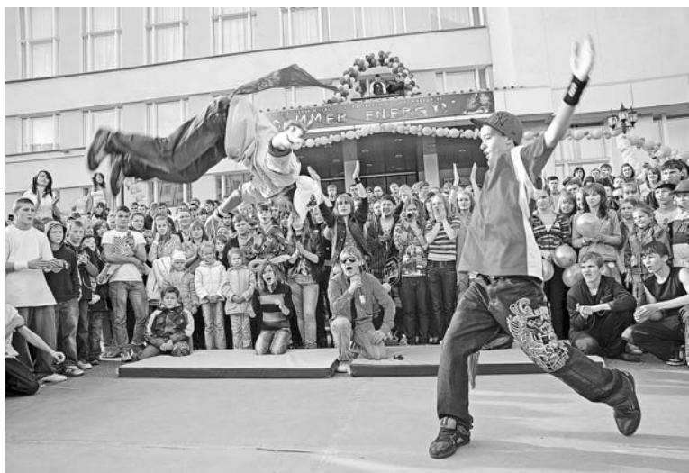
Самым ярким стало выступление поклонников хип-хопа.