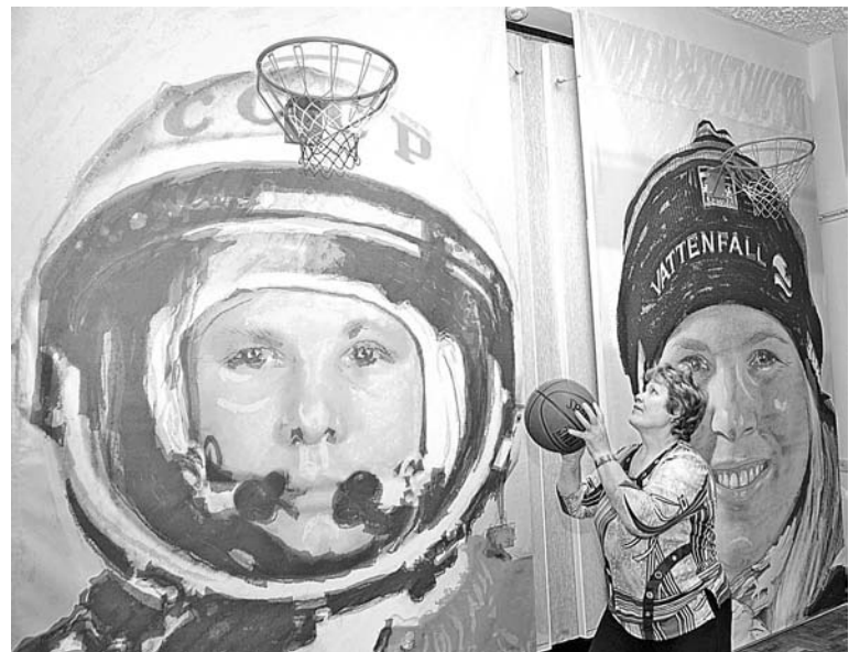
Игрушки решают проблемы Баренц-региона - девиз выставки.