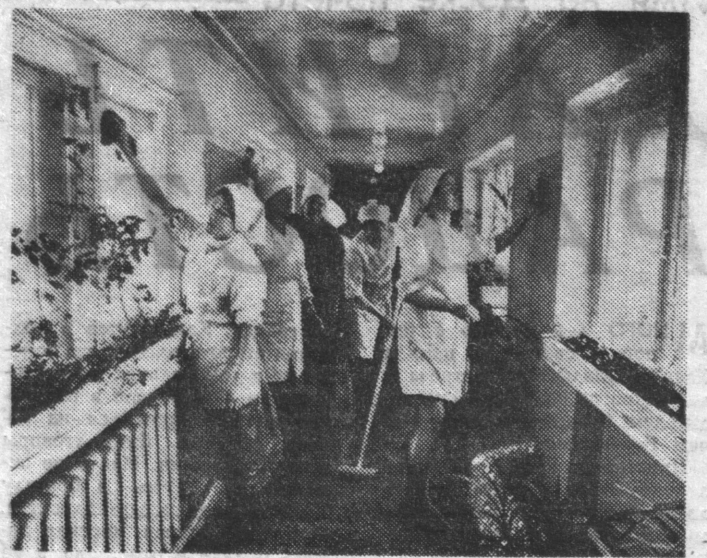
Переходная галерея, соединяющая административный корпус с главным зданием Североморского молокозавода, превращена в зеленую оранжерею. Работники предприятия заботливо ухаживают за цветами, высаженными здесь. Приятно пройти по галерее, когда за окнами бушует яростный снежный «заряд»... Много зелени и в кабинетах административного корпуса, и