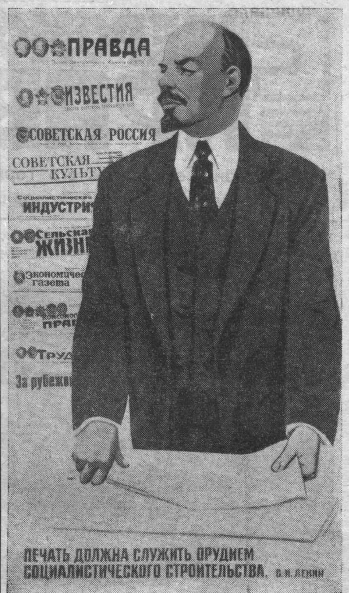
Плакат художника Э. Арцруниана.