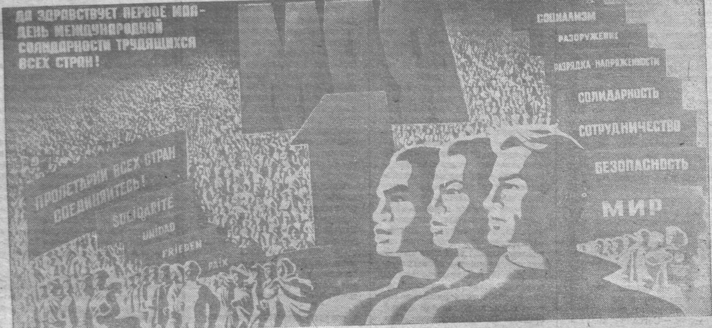
Плакат художников З. Смехова и Д. Филатова.