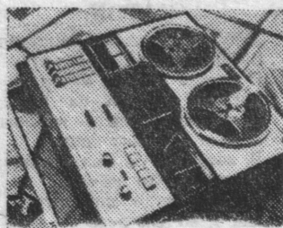
Коллектив Новосибирского завода точного машиностроения в 1978 году обязался выпустить более 100 тысяч магнитофонов «Комета-212». НА СНИМКЕ: стереофонический магнитофон «Комета-212».

Конференция приняла обращение ко всей общественности, призвала повсеместно усиливать работу по предупреждению пожаров.