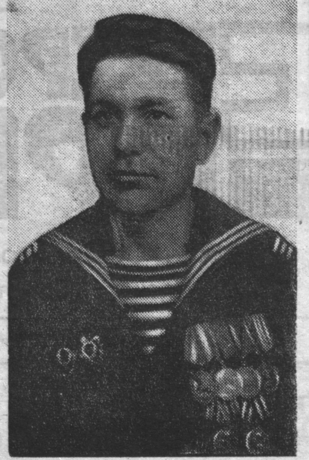
На снимке автор. Фотография 1945 года.

С победой мы вернулись в родную базу. На берегу нас ждала торжественная и теплая встреча друзей. Команды других катеров были выставлены на пирсе. Такой почет обязывал ко многому, и наши комсомольцы сделали все, чтобы оправдать доверие Родины. И они оправдали это доверие. И те, кто погиб, и те, кто остался жив. К транспорту, отправленному на дно 22 апреля, экипаж «ТКА-13» приплюсовал другие победы. И хотя 15 сентября 1944 года легендарный катер, а с ним и многие члены экипажа погибли в неравном бою, живые отомстили за товарищей новыми ударами по вражеским конвоям.