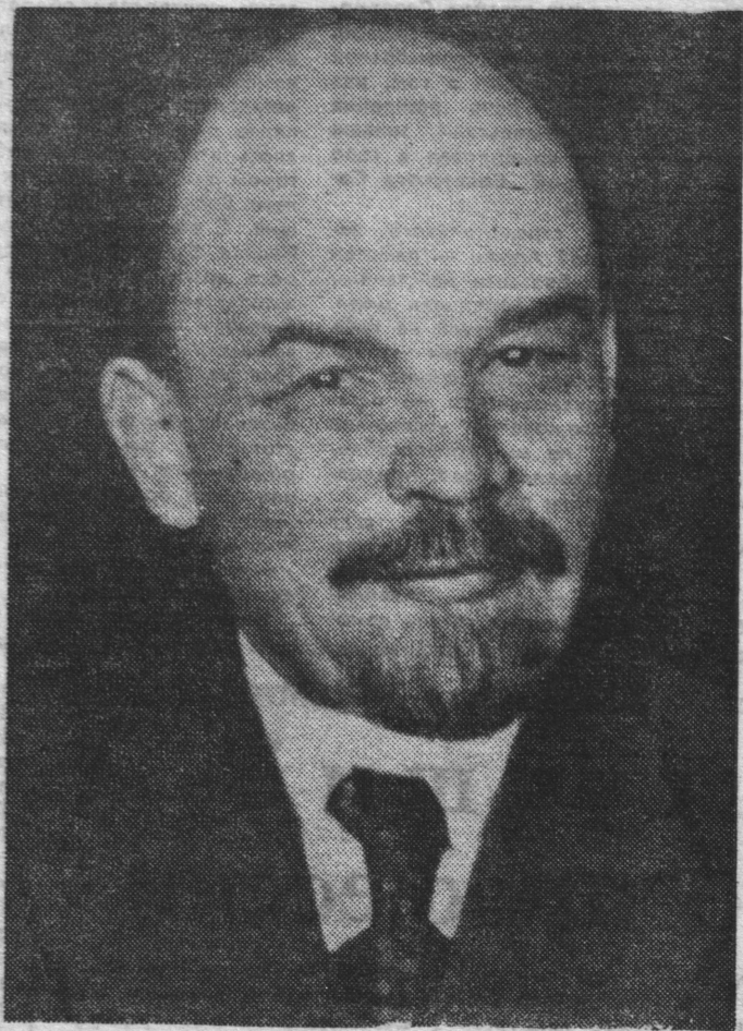
В. И. Ленин.

Сегодня — 108-я годовщина со дня рождения В. И. Ленина