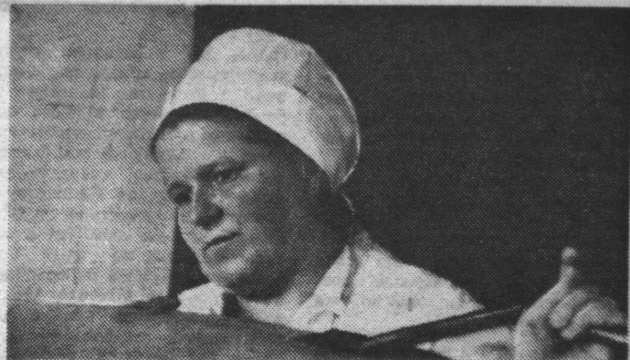
Производительность труда студневаров Северноморского колбасного завода в юбилейном году составляла 110—115 процентов. За счет экономии сырья бригада выпустила сверхплановой продукции на 820 рублей.

Отличный старт взяли члены этого коллектива и в 1978 году, году ударного труда. Традиции юбилейного трудового соперничества помогают пищеводам решать все поставленные задачи качественно, с наибольшей эффективностью.