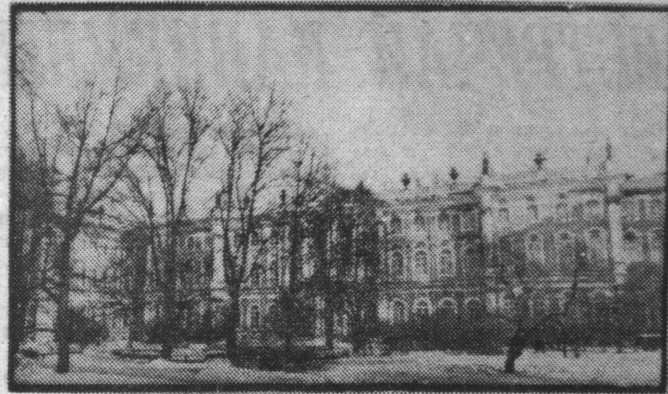
В Ленинградских музеях собраны шедевры русского и мирового искусства. Государственный Эрмитаж — один из самых известных и богатых музеев мира.