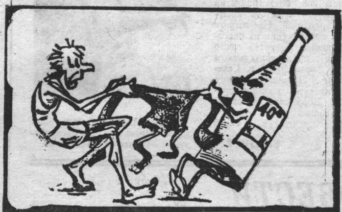
— Что же ты со мной делаешь! Здоровье унесла, совесть отняла, так хоть штаны отдай! Рисунок В. Зелинского.