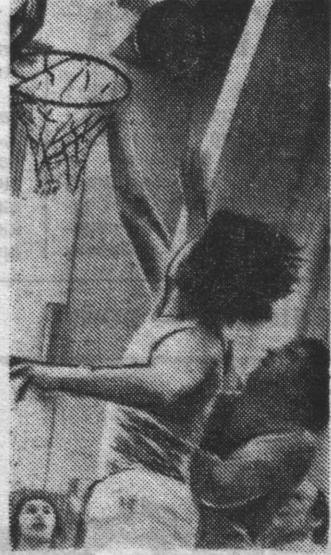
НА СНИМКЕ: один из эпизодов первенства по баскетболу.