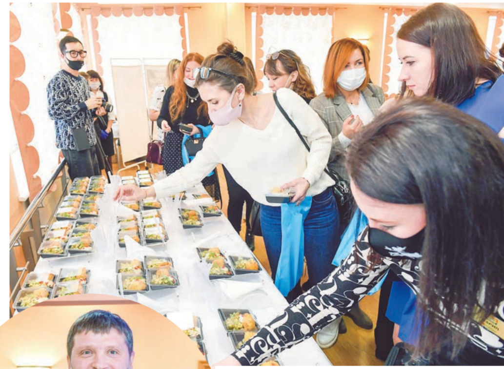
Многие участницы конференции взяли рецепты екатеринбургского мастера на заметку.

— Мы выясняем и анализируем, от чего зависит долгосрочная устойчивость, жизнестойкость и счастье человека. Мне нравится помогать людям акцентировать внимание на простых вещах, нашем поведении, ежедневных поступках, которые напрямую влияют на уровень благополучия человека. С северянками мы поговорили о том, что является причиной нашего благополучия. Это и уровень физиологии — как лучше следить за своим телом, чтобы оно стало генератором счастья, а не генератором страданий, и эмоциональный уровень — какие инструменты помогают поддерживать максимально здоровый эмоциональный фон. Негативные эмоции дают в тот момент, когда мы