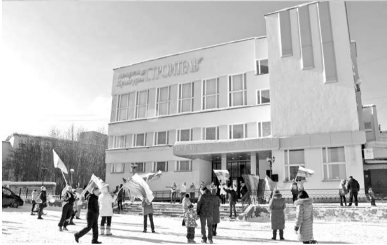
471 млн.руб. планируется направить на строительство крытого бассейна, капремонт школы №12 и фасада ДК «Строитель».

28 февраля состоялось заседание регионального Правительства под председательством губернатора Мурманской области Андрея Чибиса. На повестке дня две темы: реновация ЗАТО, населенных пунктов с дислокацией военных формирований, и развитие туризма.