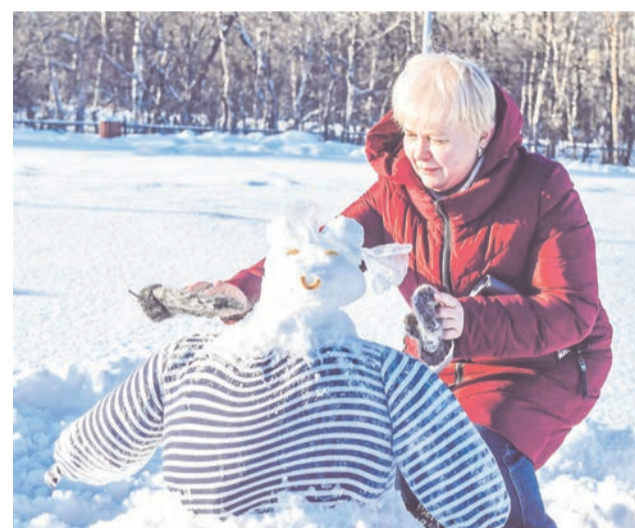
Снеговичок-морячок от Елены Березки.