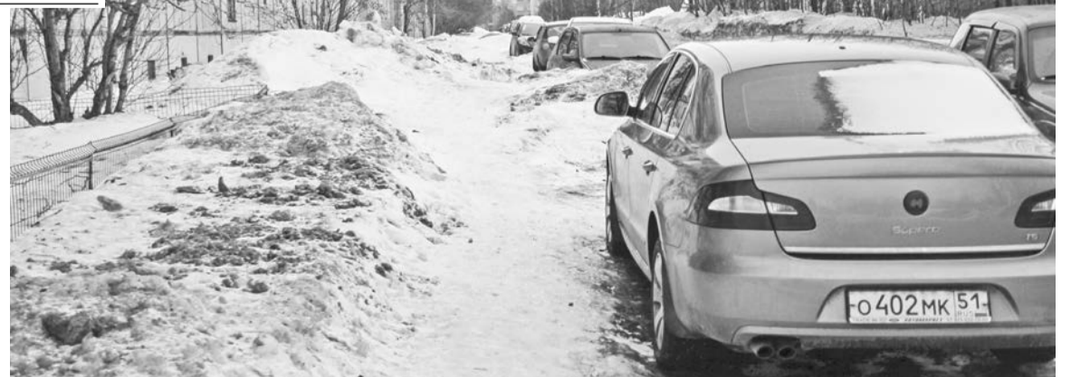
На этом месте, у дома №51 по улице Гвардейской, был тротуар, а теперь только снег и перекрывающий ему доступ спецтехники автотранспорт.