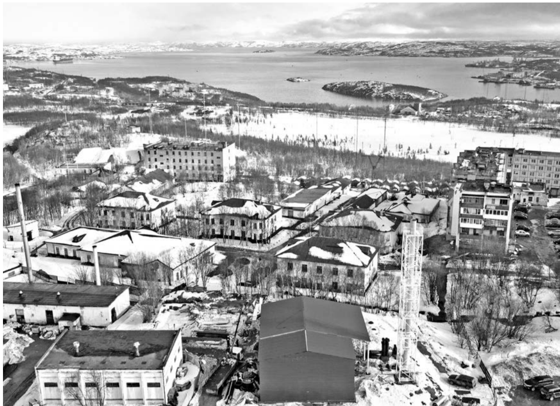
С новой угольной котельной жители микрорайона ул.Кортик связывают надежду на стабильное отопление и чистую горячую воду.

А из ответа Госжилинспекции Мурманской области на аналогичный запрос жителей следует, что не важно, на каком топливе работает котельная — уголь или мазут, — для населения тариф на вырабатываемую тепловую энергию единый. «Указанный тариф не устанавливается отдельно по котельным, а един для населения на всей территории муниципального образования. Важно отметить, что на территории ЗАТО Североморск установленные тарифы ниже уровня экономически обоснованного тарифа, определен-