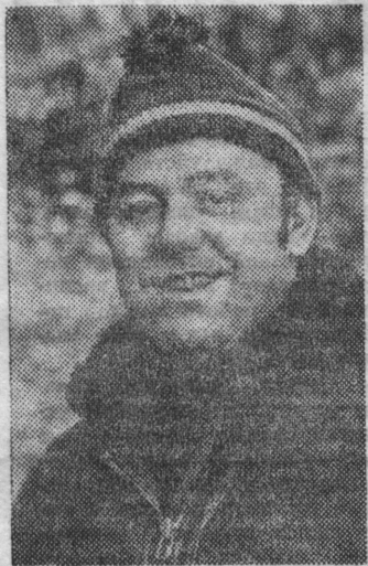
Редактор В. С. МАЛЬЦЕВ.