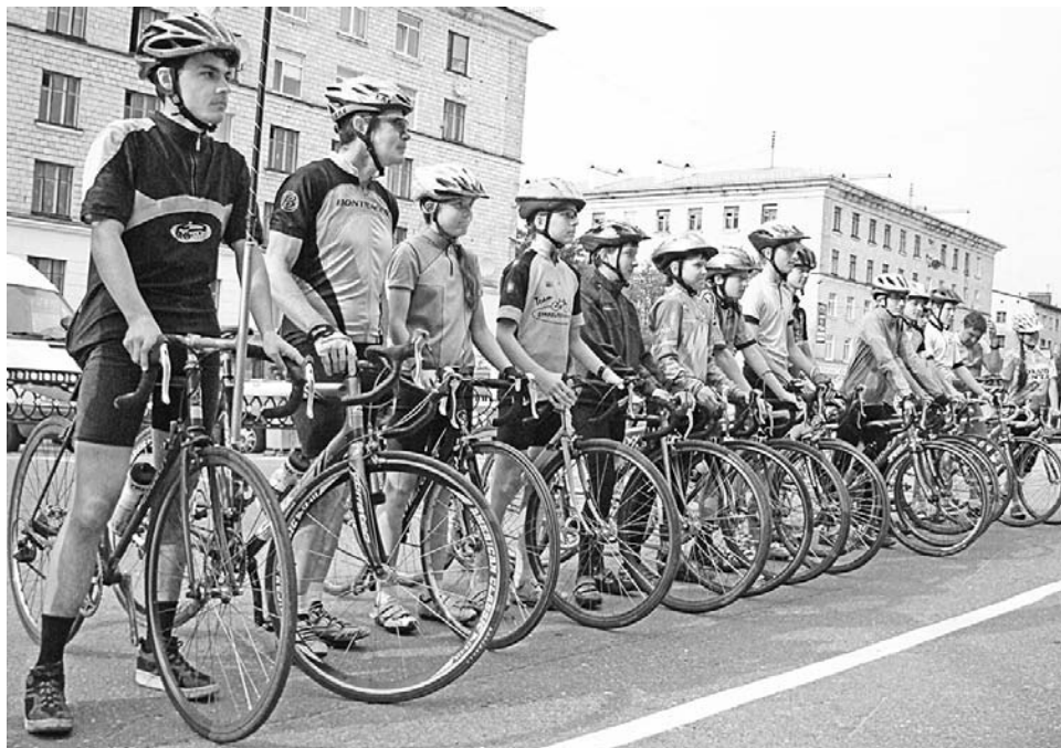
«Пилигримы» вернулись. Позади Финляндия, Швеция, Норвегия.

Давно ли было 14 июня: взволнованные родители, проводы «Пилигримов» в велопробег детей и молодежи по странам Баренцева региона. От одних цифр кружилась голова: 4 страны, 47 дней, 4700 километров... Сколько приключений впереди!