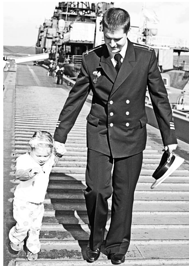
Даже успешное завершение учений не радует так, как встреча с родными.