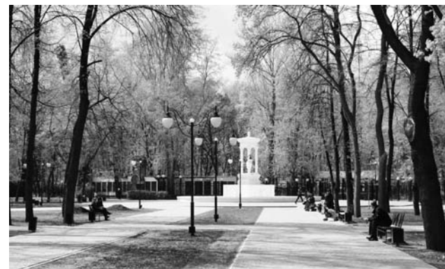
Удобные скамейки, изящные фонари и современная плитка появились в детском парке «Орленок» в прошлом году.