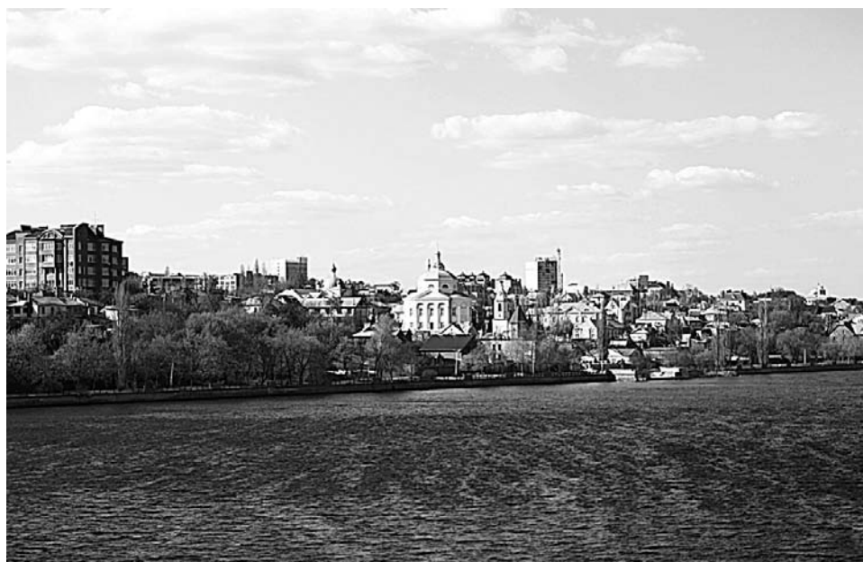
С Чернавского моста открывается живописный вид на город.