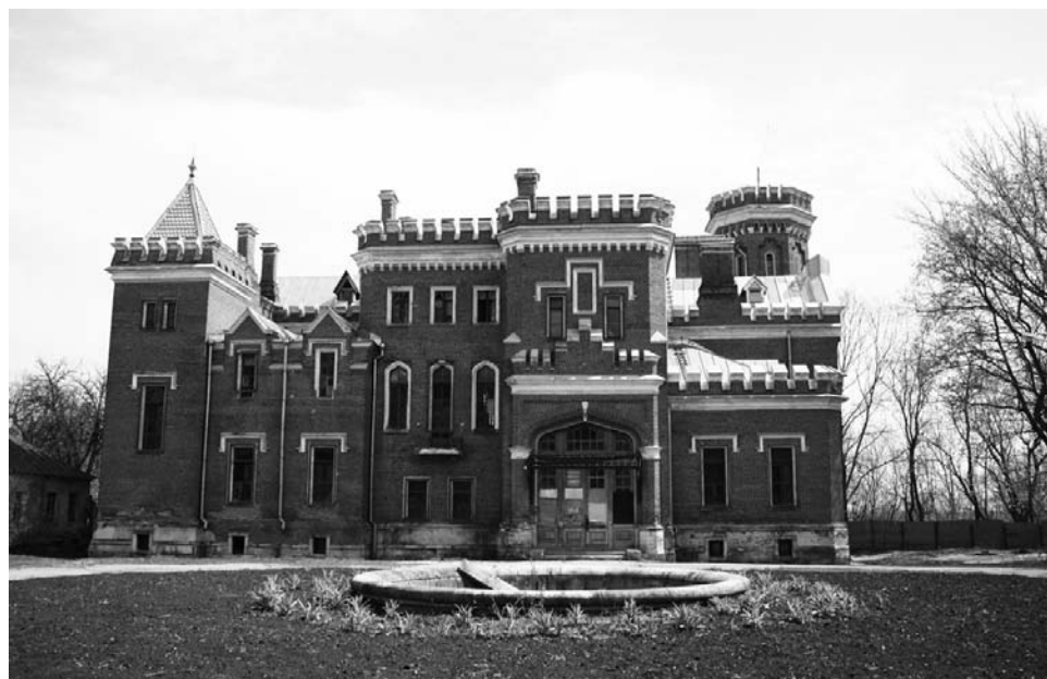
Говорят, по рамоньскому дворцу бродит призрак принцессы Евгении.