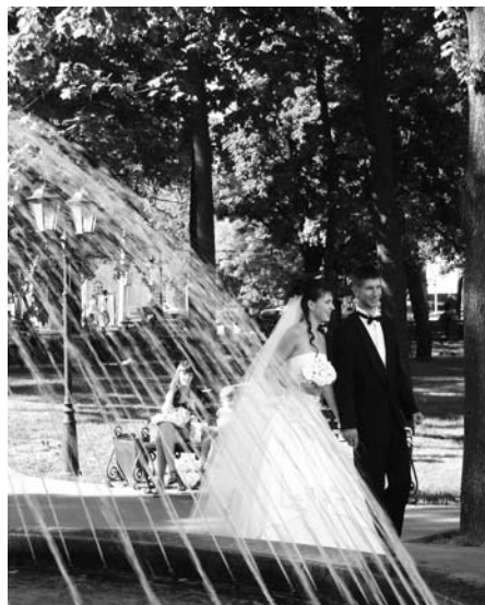
Петровский сквер - место свадебных фотосессий.

Вылечив зубки и прогулявшись по скверам, выходящая положенные пару часов, отправляемся на обед. По пути обязательно заглянем в одну из пекарен. Воронежский хлеб – удовольствие незабываемое и недорогое. Где еще вы видели батон за 9 рублей, а то и дешевле? Непременно отведайте штрудель с вишней и нежным кремом – это будет самый вкусный штрудель в