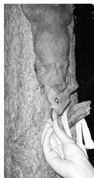
От кусочка огурчика воронежские белки не откажутся.