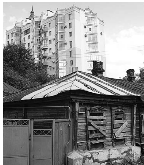
И все-таки старые кварталы до-бавляют городу очарования.