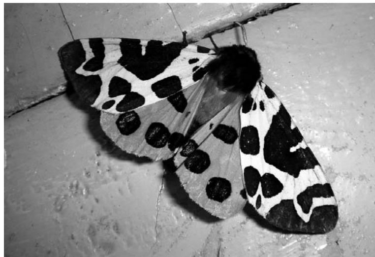
Ночная бабочка медведица кайя встречается от Калининграда до Владивостока.

А знаете ли вы, что не все белянки (есть такое семейство) белее? Например, зорька, или аврора, весьма распространенный вид, встречается и на Кольском полуострове. В Средней полосе она появляется уже в конце марта. Полет авроры невозможно не заметить: в воздухе будто появляется яркая рыжая вспышка. Эффект создают оранжевые пятна на верхних крыльях. К слову, такая окраска – привилегия самцов. В Мурманской области также встречается, но редко, желтушка торфяни-