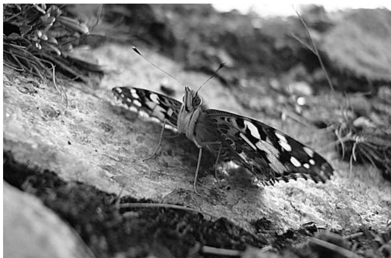
Эту репейницу удалось сфотографировать на сопке у памятника Алеше 5 сентября прошлого года.

ковая. Название говорит само за себя. Правда, желтые крылья опять же у самцов – у противоположного пола они беловатые. Но у обоих на крыльях есть широкий черный кант.