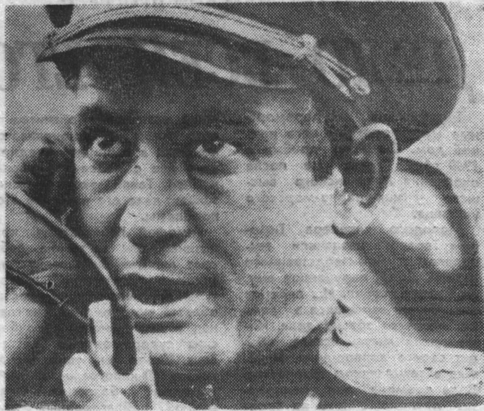
стран. Люди никогда не забудут о том, что каждый второй советский воин, пришедший в Европу с миссией освобождения, был коммунистом или комсомольцем. Каждый второй! Им — подлинным героям современности, коммунистам нашей эпохи — посвящены все четыре фильма «Солдаты свободы». Г. ГАЗИНСКАЯ. На снимке: кадр из фильма.

Киноэпопея «Солдаты свободы» — это история нашего народа, Коммунистической партии и компартий братских