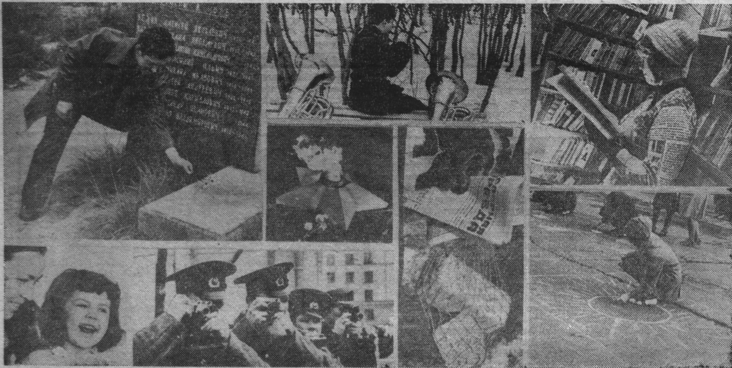
Хотят ли русские войны?

Новых тебе успехов, комсомольско-молодежный! Г. СЕНЬКОВА.