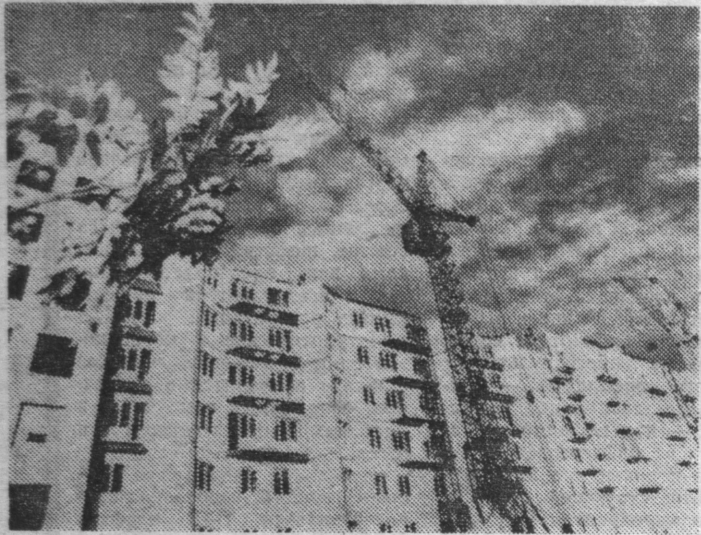
В новом микрорайоне города Североморска.