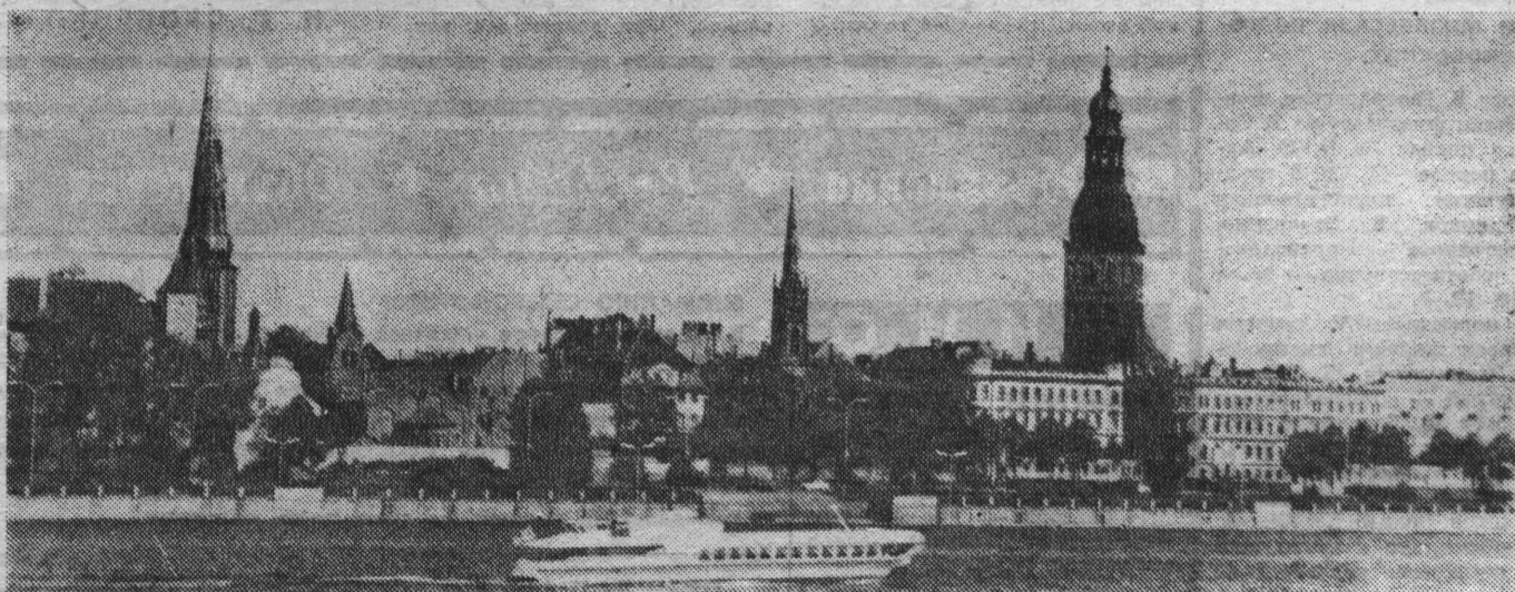
ЛАТВИЙСКАЯ ССР. Рига. Комсомольская набережная.

Характерная черта нынешнего этапа развития латвийской индустрии — усиленное внимание к интенсификации производства и качественным факторам. Сегодня только на рижских предприятиях выпускается более тысячи видов изделий со знаком качества. Есть немало предприятий, где продукция, аттестованная по высшей категории качества, занимает в