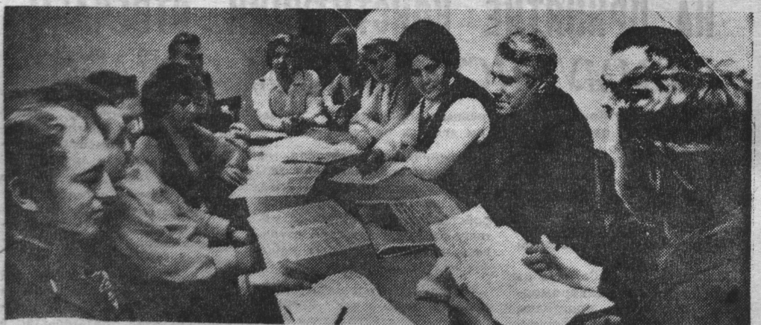
На снимке: идет занятие в сети партполитучебы в конторе «Североморскгоргаз».